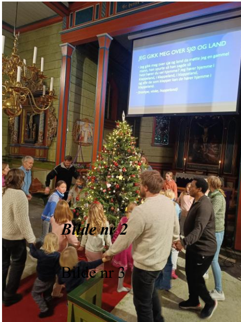
Bilde nr 2