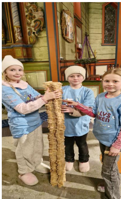
Julefest med tårnagentar januar 2026. Dei tre vise menn kom med godt til borna.