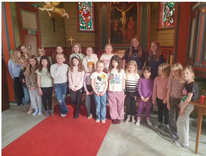
Barnekoret på øving i kyrkja