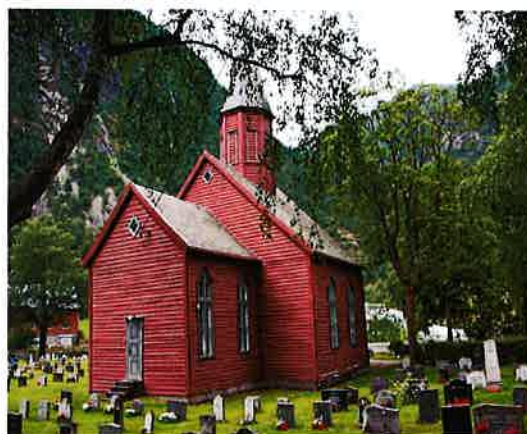
Deretter vart den måla i 2013

Kyrkja vart sist måla innvendig i 1991. Det vart samstundes føreteke kontroll av det elektriske anlegget og det vart lagt opp ein del nye leidningar. Målinga har halde seg godt og i planperioden er det berre trong for mindre vedlikehald.