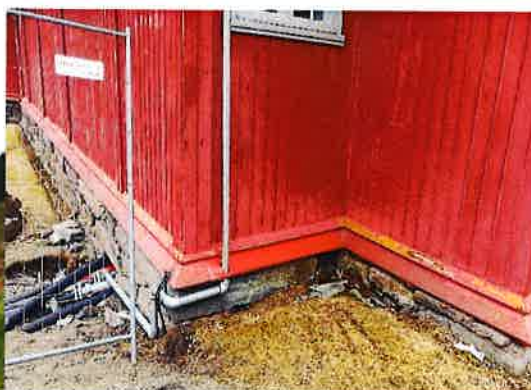
Målinga byrjar no å bli svært slitt

Kyrkja vart måla både utvendig og innvendig i 1993 til 125-års jubileet. I 1999 utarbeida Arkitektkontoret 4B ein tilstand- og vedlikehaldsrapport i høve kyrkja. På bakgrunn av rapporten vart det 2001 utførte ein del arbeid på kyrkja. Det vart lagt nye heller på deler av taket og kyrkja vart måla frå det nedre taket og opp (også listeverket på vindauga). Resten av kyrkja vart ferdigmåla i 2006. Målinga byrjar no å miste glansen, og er blitt slitt heilt ned på trevike enkelte plassar. Det er ynskeleg å måle kyrkja i 2019.