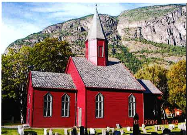
Kyrkja da den stod ferdig måla i 2003

Det vart lagt nytt tak på kyrkja i 2000. Kyrkja vart måla raud utvendig i 2003, før den tid var kyrkja kvit. I 2004 skifta ein alle inngangsdører og trappa vart utbetra og ein fekk rullestolampe. Bygget er forma slik at det skrår utover nede. Dette har medført avflassing av måling nede på veggen på grunn av vass slitasje. Då ein måla kyrkja monterte ein samstundes takrenner for å unngå dette problemet. Kyrkja vart sist måla i 2013 og det er ikkje trong for måling i planperioden.