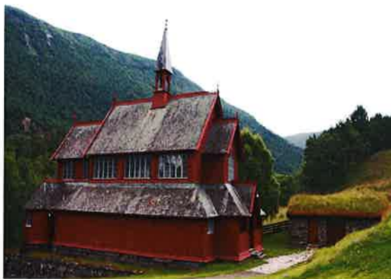
Kyrkja vart måla i 2006

Den gamle stavkyrkja på Borgund vart i 1866 selt til Fortidsminneforeininga, mot at dei betalte 2/3 av kjøpesummen til ny kyrkje. Årsaka til at ein måtte bygge ny kyrkje på Borgund, var at den gamle var for lita etter lova frå 1851 som sa at kyrkjene i riket skulle kunne romme 1/3 av folkesetnaden i soknet. Fortidsminneforeininga fekk arkitekten Chr. Christie til å utarbeide teikningar til kyrkja. I august 1868 vart kyrkja vigsla. Nye kyrkja var laga av spesialiserte handverkarar frå Christiania; ho var ei panelert bindingsverk-kyrkje med kunstnarlege ambisjonar. På lik line med Hauge kyrkje er nye kyrkja på Borgund i ny-gotisk stil. Kyrkja er ei langkyrkje i tre med om lag 150 sitjeplassar.