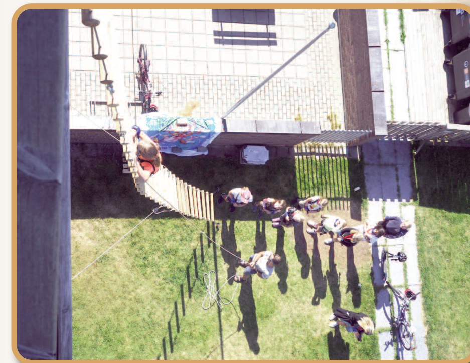
Agentene skal til vær!