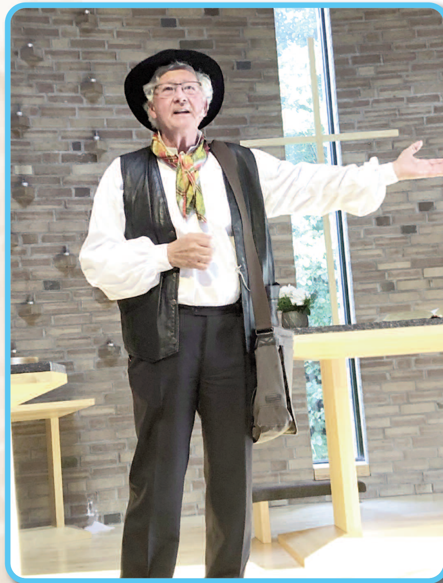
Hans Nielsen Hauge i Berg.