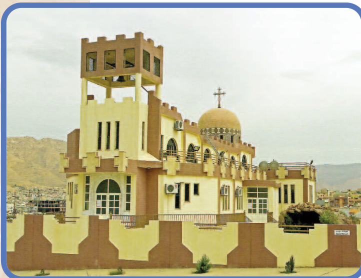
Assyriske kirke på kurdisk område bygd i 2006

Det er altfor komplisert å redegjøre videre for egenarten og historia til de forskjellige kristne grupperingene i det området som nå utgjør Kaukasus, Tyrkia, Syria, Iran og Irak fra 14-1500-tallet og framover. I mangel av et bedre uttrykk kan vi kalle dem assyriske kristne. De var minoriteter, men hadde i alle fall i teorien en viss rettsbeskyttelse innafor det osmanske riket.