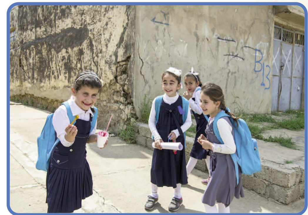
Jenter i den kristne landsbyen Tel Skuf i Nord-Irak - er det ei framtid for dem?