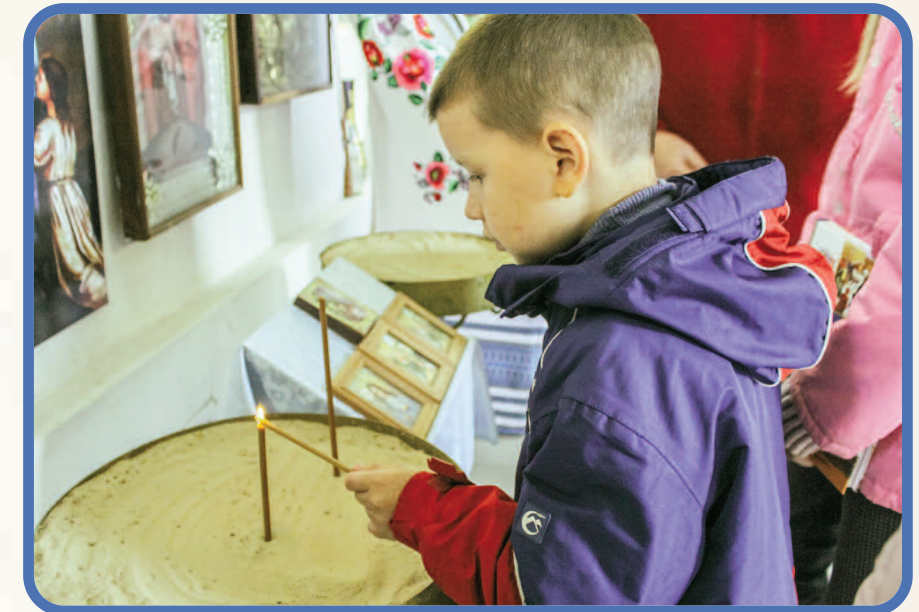
Fra Ukraina

Det er stor kontrast mellom forsidebildet i dette nummeret av Såmannen med de to væpna soldatene og Bibelen, og den lille gutten her som tenner lys i en kirke. Men påskebudskapet ligger på sitt vis i bunnen for begge bildene. Det ukrainske bibelselskapet forteller at de ikke klarer å dekke etterspørselen etter bibler, verken fra soldatene ved fronten eller fra befolkninga ellers. Bibelen bidrar til å skape håp i en svært truende situasjon for land og folk. Bibelselskapet er et fellestiltak for flertallet av kirkene i Ukraina. I mai 2022 kom det ut en egen barnebibel med 220 fargeillustrasjoner.