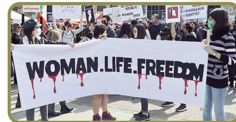
Store protester mot behandling av kvinner i Iran

De siste 25 årene har SAT-7 hatt en visjon om å hjelpe kvinner og jenter å se sin gudgitte verdi og verdighet, komme med uttalelser, bli hørt og gi grunnlag for å skape sterke, trygge og kjærlige familier. I dag fortsetter SAT-7 å styrke kvinner som koner, søstre, døtre, mødre, bestemødre og medlemmer av samfunnet, skriver organisasjonen i meldingsbladet sitt i mai 2020. Dette engasjementet har ført til man også har vært med i de store opptøyene i Iran.