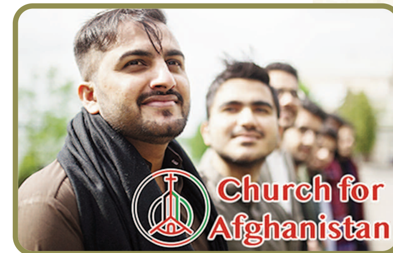
Også i Talibans Afghanistan finnes det kristne

De siste åra har myndighetene der slått ned på kirker. De har tvunget mange av dem til å stenge og hindra kristne å delta i fellesskap og bønn.