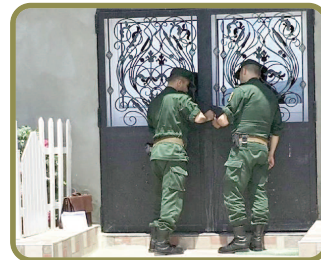
Politiet stenger kirke i Algerie