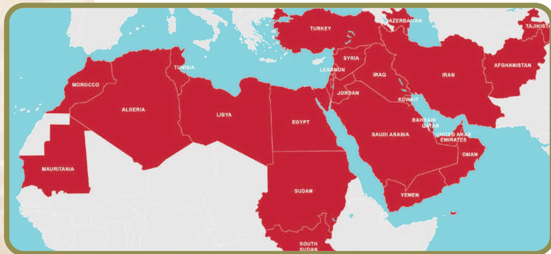
Kart over Midt-Østen og Nord-Afrika

Som vi ser av kartet, dekker sendingene store områder med flere hundre millioner mennesker, som lever under svært varierende forhold. I de fleste landa er islam dominerende, og de har i tillegg temmelig autoritære styresett. Det meste av området har også ei kristen forhistorie. Før araberne erobra det på 600-700-tallet, spilte kristendommen ei sentral rolle, men siden den tid har det skjedd ei sterk islamsisering. Mange steder er det imidlertid fortsatt kristne kirker og menigheter. Sterkest står den koptiske kirken i Egypt.