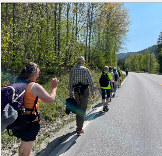
Fra turen i 2023 Drammen - Hemsedal

Friluftsgudstjeneste på Verdens Ende avslutter GOFORIT - tur med tru. Gudstjenesten er i samarbeid med Tjøme menighet.