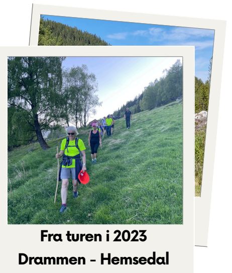
Fra turen i 2023