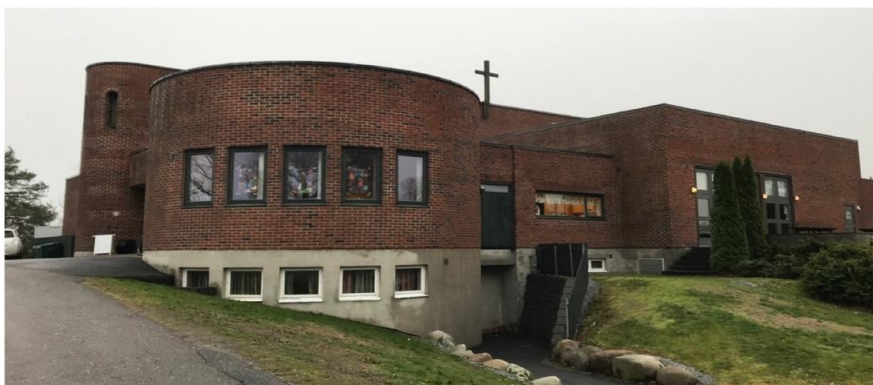
Nanset kirke, fasade og tak med stort utbedringsbehov