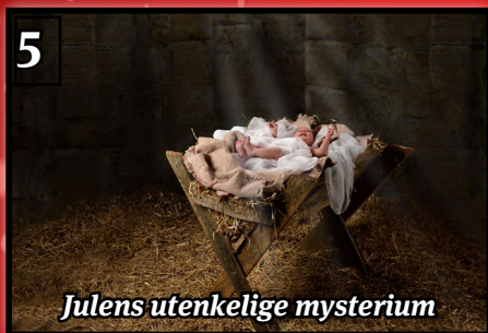
Julens utenkelige mysterium