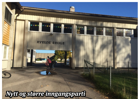
Nytt og større inngangsparti