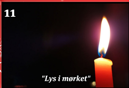
"Lys i mørket"