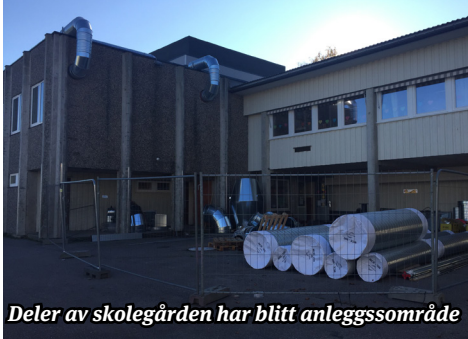
Deler av skolegården har blitt anleggssområde

Det mest omfattende arbeidet er innstalleringen av nytt ventilasjonsanlegg på barneskolen (det vi kaller 77-bygget). Dette arbeidet ble påbegynt i juni i år, og er i skrivende stund ennå ikke ferdigstilt. Selv om skolen kanskje får et mer industriaktig utseende med store metallrør på utsiden, vil et nytt ventilasjonsanlegg bety veldig mye for inn klimaet og det fysiske læringsmiljøet for både elevene og personalet på skolen.