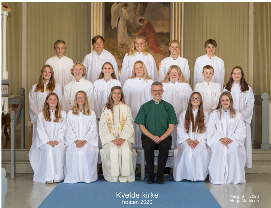
Kvelde kirke høsten 2020

Men det ble allikevel et flott konfirmantår, spør du meg. Høsten 2019 hadde så vidt rukket å komme før vi dro på leir til Solåsen leirsted, en helg pakket med trivsel og samhold. Det var sporløype, undervisning, god mat, kveldsvandring, gudstjeneste, litt for lite søvn, underholdningskveld og mere til. Deretter gikk det slag i slag gjennom høsten. I november stakk vi av med 2. plass og pokal på Konf.cupen i Stavernhallen.