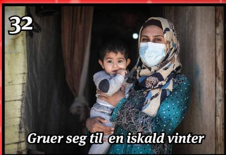
Gruer seg til en iskald vinter

Se også våre hjemmesider: www.kirken.no/larvik