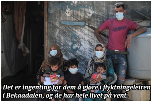
Det er ingenting for dem å gjøre i flyktningleiren i Bekaadalen, og de har hele livet på vent.

økning av landets befolkning på 25 prosent og et enormt press på infrastruktur som vann, fast avfall og elektrisitet samt tilgjengelige offentlige tjenester, særlig i helse- og utdanningssektorene. Ifølge Lebanon Crisis Response Plan (LCRP) 2019, mangler 3.208.800 tilgang på trygt vann. Dette kan føre til alvorlige helserisikoer og eksponering for sykdom, særlig under overbefolkede leveforhold som enkle teltbo-settinger og husrom av dårlig kvalitet.