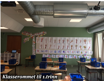
Klasserommet til 1.trinn

Det neste store prosjektet som skal gjennomføres, er oppgradering av uteområdene og lekeapparatene på skolen – dette får hele bygda glede av!