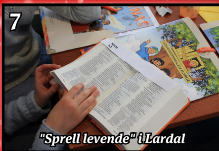
"Sprell levende" i Lardal