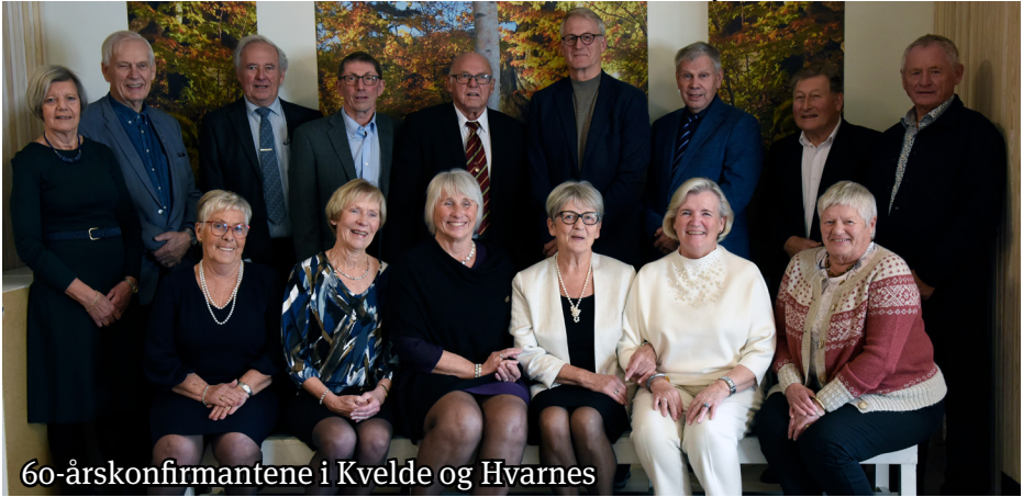
60-årskonfirmantene i Kvelde og Hvarnes

Etter gudstjenesten i Kvelde kirke kl. 11:00 var det samling på Kvelde bedehus med servering av lapskaus, kaffe og kaker. Praten gikk livlig, som seg hør og bør når mennesker treffes etter lang tids pause, og flere gikk fram til mikrofonen for å dele minner og artige historier fra konfirmanttida. En stor takk til dere som var med på festen!