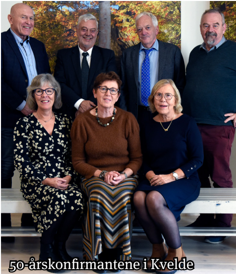
50-årskonfirmantene i Kvelde