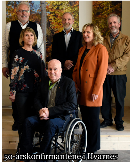
50-årskonfirmantene i Hvarnes