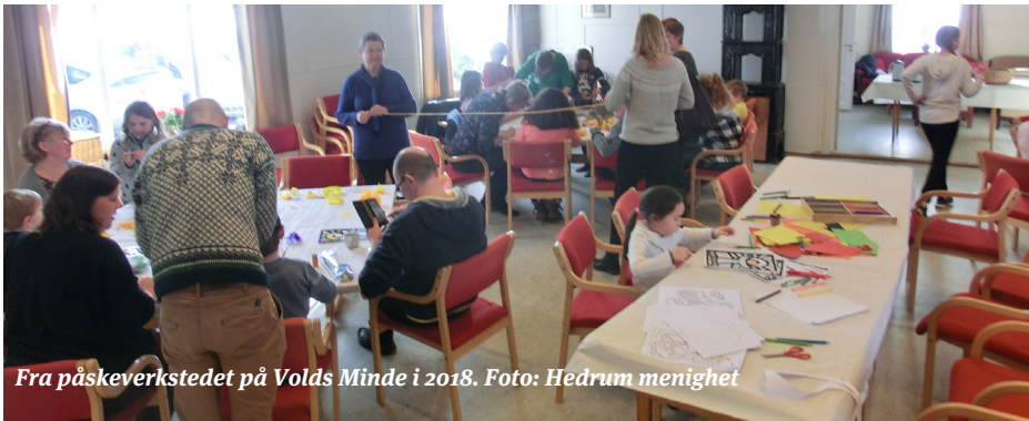
Fra påskeverkstedet på Volds Minde i 2018.

En av tradisjonene i Hedrum menighet er det årlige påskeverkstedet på Volds Minde ved Hedrum kirke for hele familien. Lørdagen før palmesøndag i påsken samles vi til en koselig ettermiddag med enkel matserving. Deltagerne får høre påskens budskap, vi synger påskesanger og lager påskepynt sammen. Nå har det gått 2 år siden vi kunne samles sist, og denne gangen kan vi endelig samle alle igjen lørdag 9. april fra kl. 14:00 til kl. 17:00. Små og store er velkommen, og barn under skolealder må ha med en voksen.