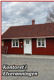
Kontoret i Elverønningen

Utfører tilstandsrapporter, låne- og verditakst, byggelånsoppfølging og forhåndstakster.