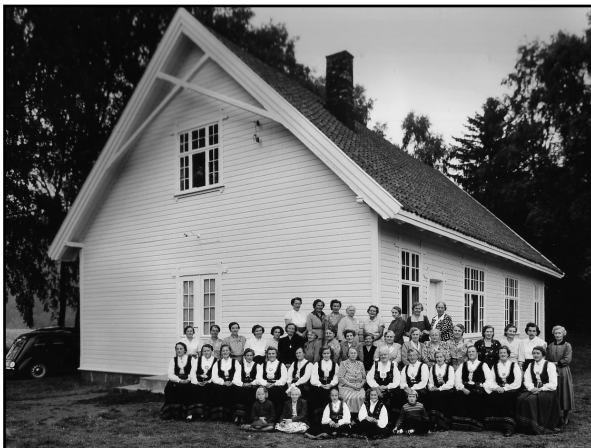
Fra innvielsesfesten for nyrestaurert Volds Minde 9. sept. 1955. Her er samlet den største delen av medlemmene i Hedrum bondekvinneklubb, og de har grunn til å være stolte over hvor fint huset er blitt.