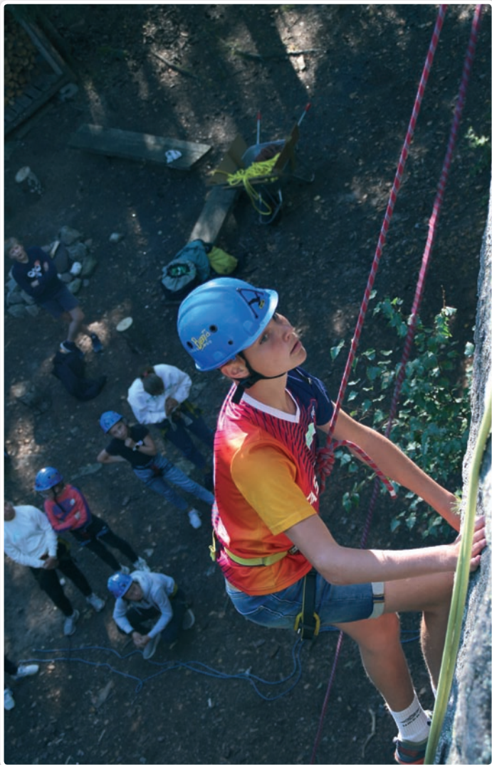
Fjellklatring og rappellering er tøft.