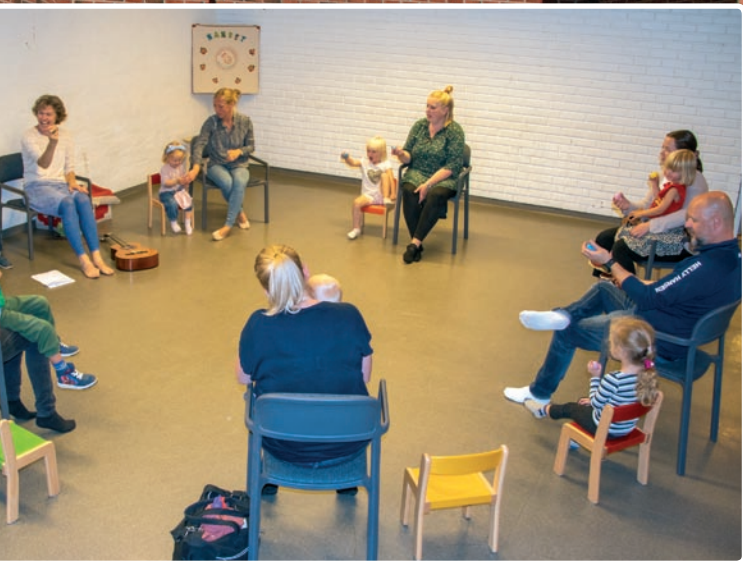
NaBaGo Mini er for barn 1-3 år ifølge med voksne.