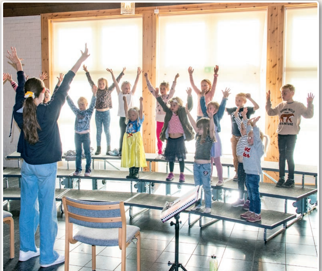
NaBaGo er i full gang med sine øvelser.