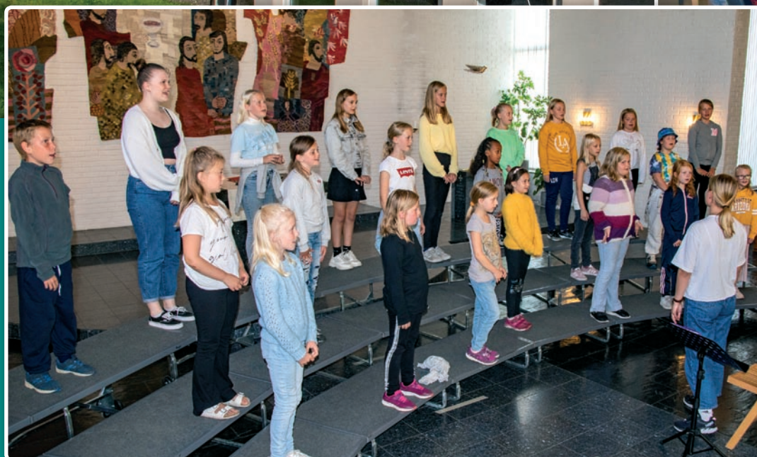
NaBaGo Pluss er i gang igjen med god plass på trulantene.

Samtidig som vi er så glade for å starte opp igjen, så er det med stor bevissthet om at vi må lage gode og ansvarlige planer for å skape trygge arenaer i forhold til smittevern. Alle aktivitetene som starter opp igjen er underlagt omfattende smittevernplaner og med noen begrensninger. Blant annet vil det på mange av gruppene ikke være noen form for matservering, og avstand og rengjøring har høy prioritet.