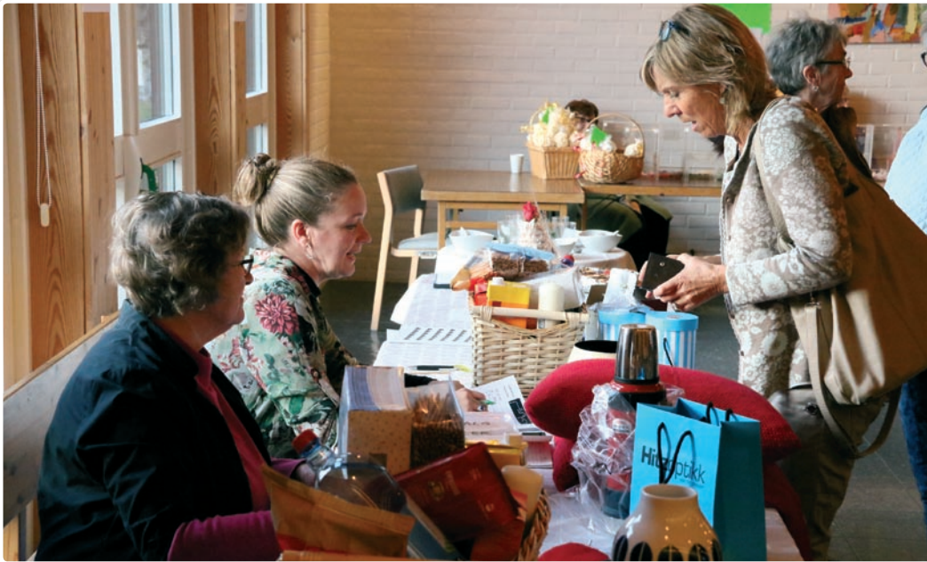
For et år siden var det basar på vår tradisjonelle måte - det blir det ikke i år.