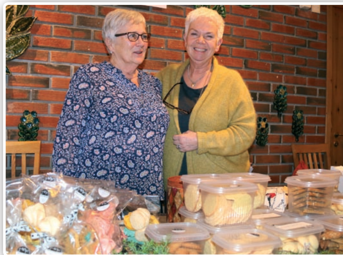
Det vil bli forsøk på salgsbord med mat.