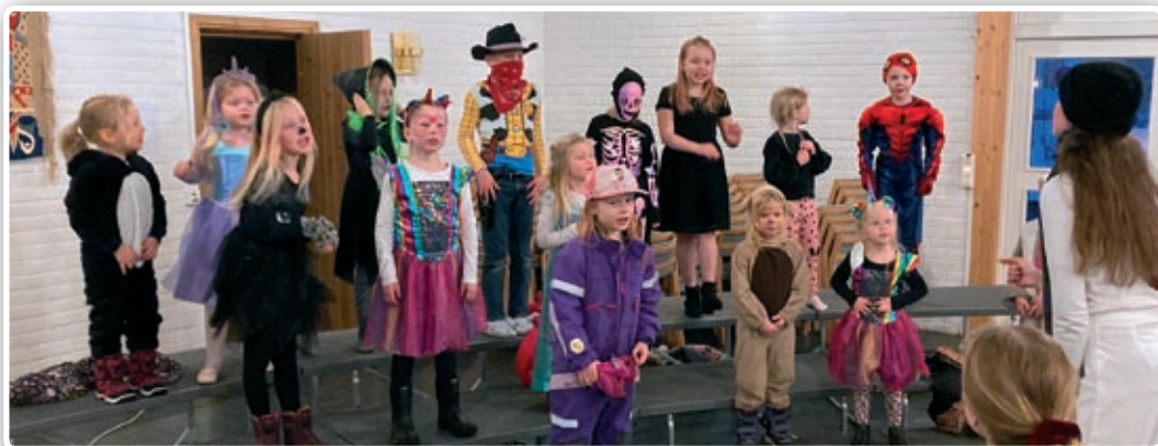
I februar var det karneval på NaBaGo.

I februar kunne korene endelig gjennomføre noe