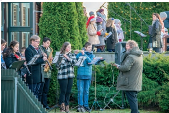
Nanset skolekorps spilte på julegudstjenesten.