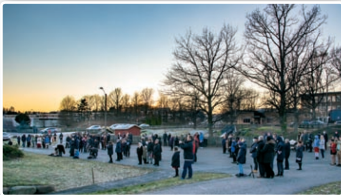
Det var påmelding til julegudstjenesten, og den ble fylt med 200 julestemte deltakere.

to hundre mennesker så vi satset på godt og tjenlig vær og gikk all in for en utegudstjeneste. Været ble fint og med korpset og barnekorene på plass ble det julegudstjeneste denne julen også. Takk til alle frivillige som deltok og takk til alle dere som kom og var med! ■