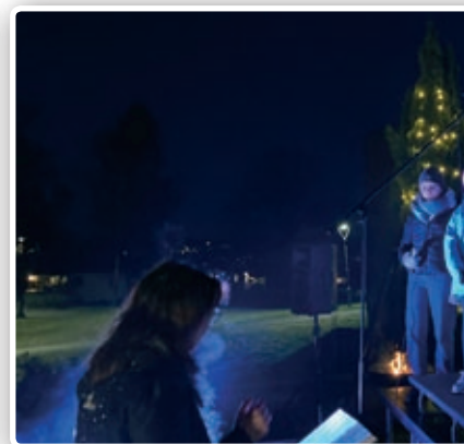
Lillejulaften sang NaBaGo-korene gjenn