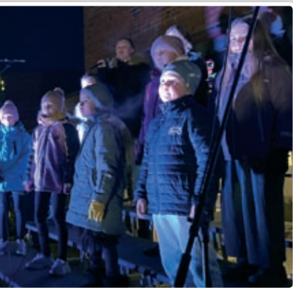
om julaftensangene, og ble promotert på NRK radio og tv.