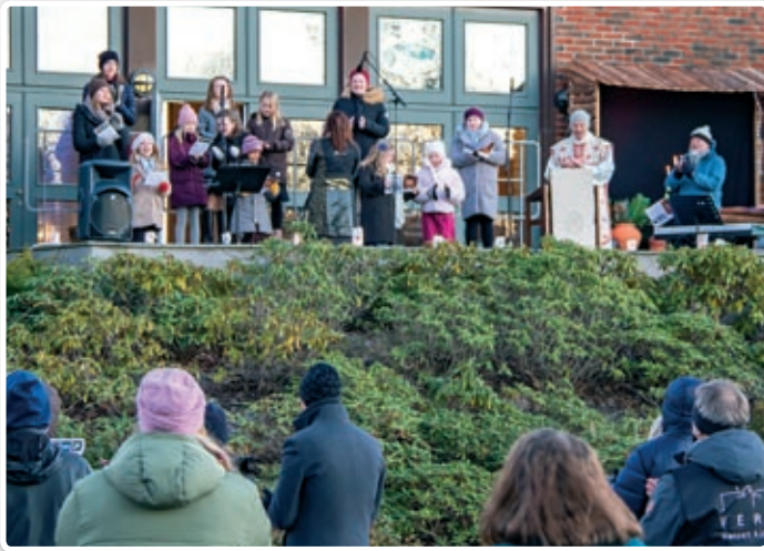
NaBaGo og NaBaGo Pluss sang oppe fra verandaen som fungerte som scene.