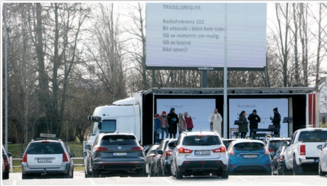
Første påskedag i fjor arrangerte vi drive-in gudstjeneste med rundt 200 deltakere - i år kan vi ikke det.