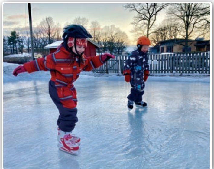
Skøytebanen var flittig brukt. I helgene var det barn og skøytet både sent og tidlig.

Dette ga mersmak; nå vil vi se om det kan la seg gjøre å planere ut deler av lekeparksen, slik at vi på vinterstid kan få skøytebane der. For parkeringsplassen vil vi helst ha full av biler; da er det folk i kirka, slik vi ønsker det aller mest! ■