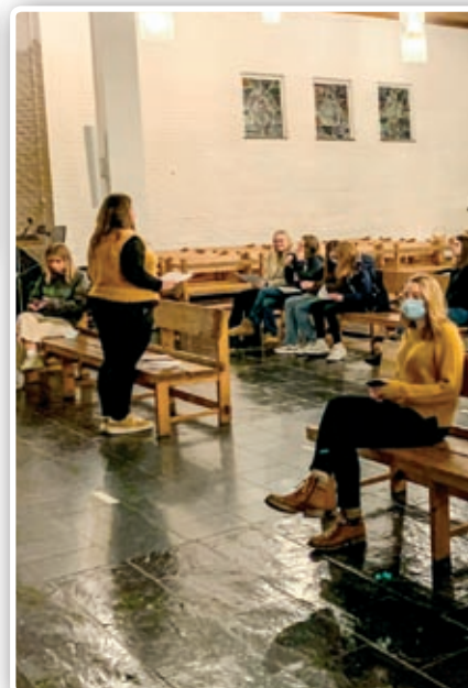
Det er ikke lett å synge i kor med to met