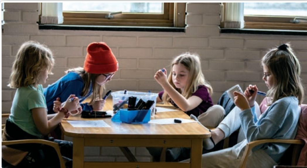
Hobbyaktiviteter for noen av dem som koste seg på «hytta».