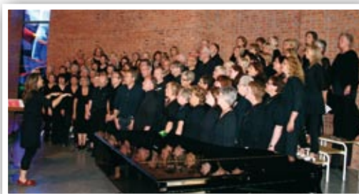
Kick sang også på søndagens gudstjeneste.