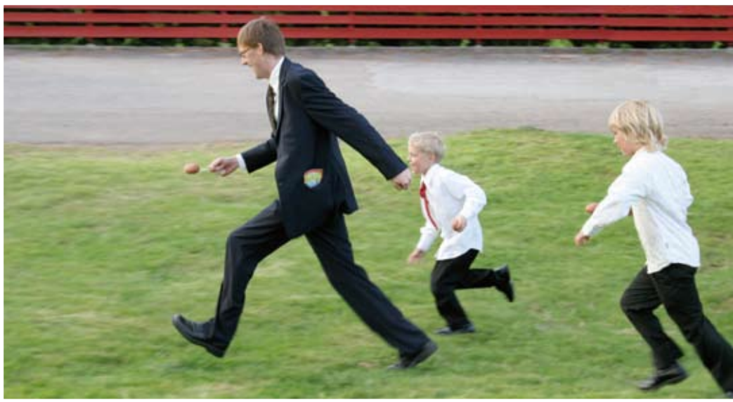
Tradisjonelle leker som potetløp er fast innslag på 17. mai-festen.

og andakt, blir det leker og enkel servering. Barn: kr 20,- Voksne: kr 40,- Familie maks: kr 100,- ■