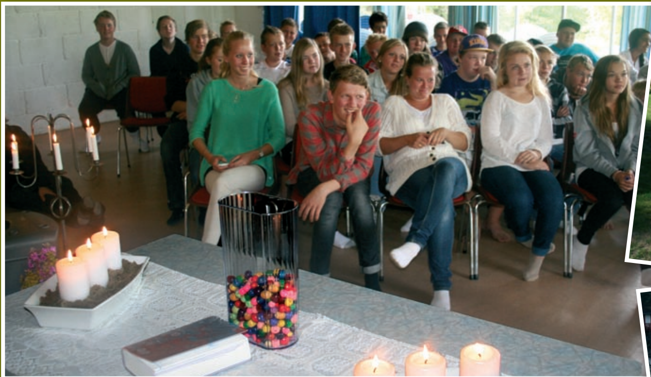
Både alvor og humor preget leiren. Her fra gudstjenesten søndag formiddag.