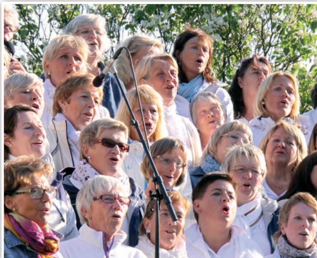
Fra Kicks sommerkonsert på Tollerodden.