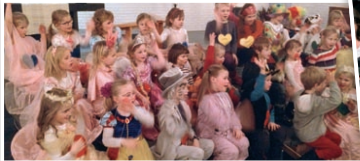
NaBaGo fra karnevalet i februar.