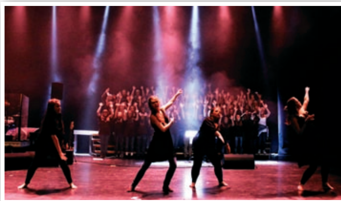
Fra en tidligere forestilling av Nanset Ten Sing.

Du vil få en super musikkopplevelse som du sent vil glemme, og sanger som «C'mon talk», «Himmelvogna» og «Blame it on the boogie» vil få fart på dansefoten.