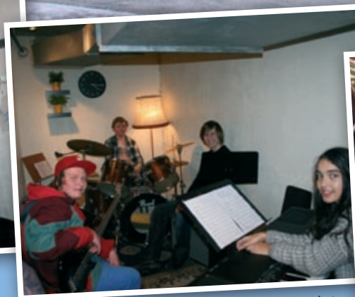
All plass er i bruk. Her har Ten Sing-bandet funnet plass til øving i vifterommet.