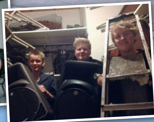
Trangt på lageret for teknikerne i Ten Sing.

Vi har et stort barne- og ungdomsarbeid i Nanset kirke. Underetasjen er spesielt innredet til dette arbeidet. På Fredagsklubben og Senfredag er det stappfullt både oppe og nede.