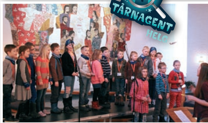
Tårnagentene var med å laget gudstjeneste.

Tårnagenter finner tips til oppdragsløsningen i Bibelen. Tårnagenter bruker hjerte og hode, og forsøker å løse oppdrag slik at Guds kjærlighet kan spres videre til alle mennesker. Kanskje har du møtt en hemmelig Tårnagent? Så mye mer enn dette kan vi ikke for-