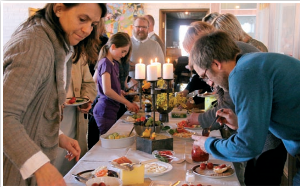
1. påskedag inviteres det til påskefrokost i Nanset kirke. Bordet er dekket. Ta med pålegg til et felles måltid før festgudstjenesten.