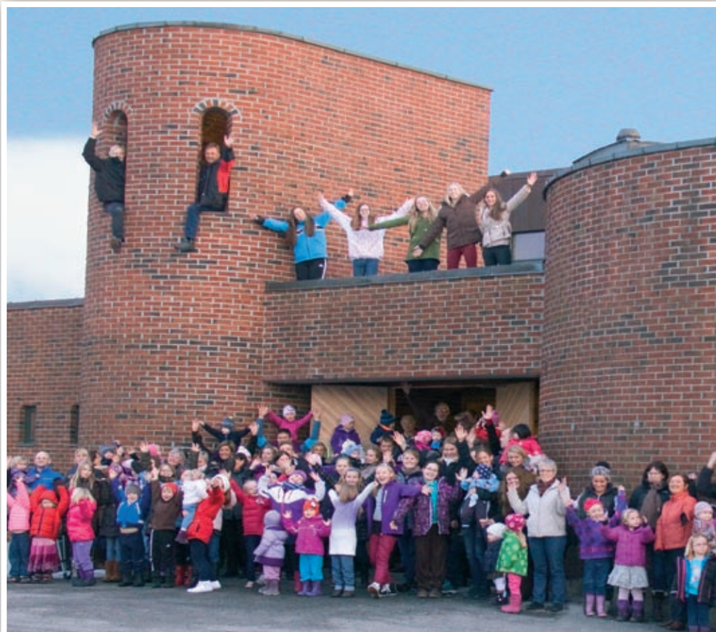
Nanset kirke er sprengfull. Nå planlegges en utvidelse.