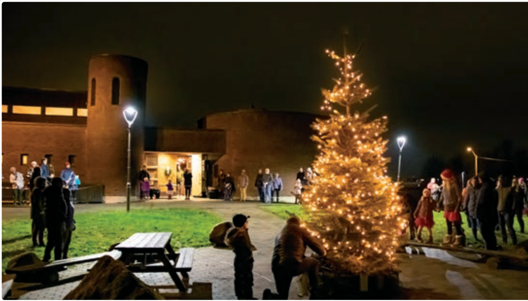
Fjorårets julegrantenning utenfor kirken.