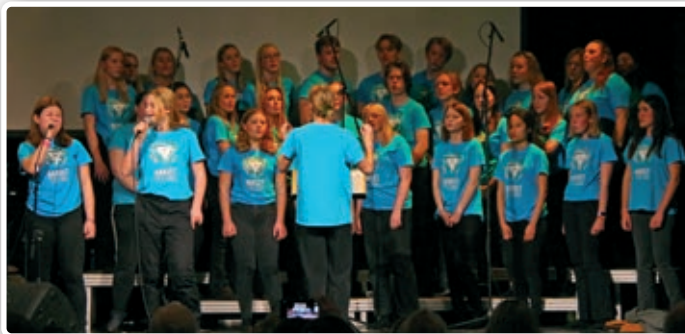
Korgjengen i Ten Sing på Festivitetsens scene.

Mandag 15. november var det endelig tid for konsert i flotte nyrestaurerte Festiviteten. Nanset Ten Sing har de siste 10 ukene øvd inn sanger, dans, drama og teknikk. Alt skrevet, laget rigget og øvet inn av ungdommene selv. Ekstra gøy var det da konserten var utsolgt til begge tidspunktene! Vi kan virkelig si at høstens konsert «Feel your