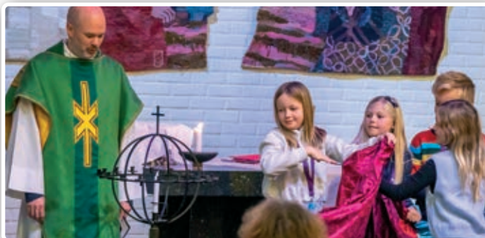
Vår nye «barneglobe» ble avduket av Tårnagentene.