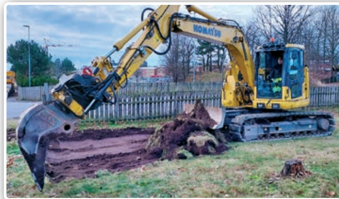
Gode naboer med gravemaskin planerte ut plassen.

Kuldeperioden varte lenge, og etter hvert som det ble kjent i nabolaget at vi hadde skøyteis kom det flere barn daglig, og hele