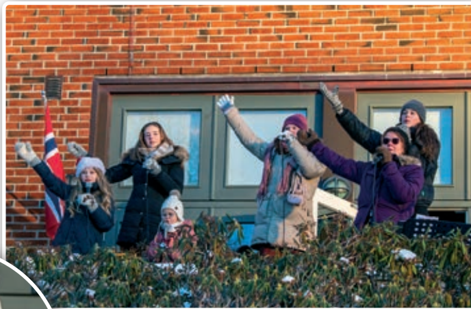
NaBaGo-korene stilte med noen sangere på den første gudstjenesten.