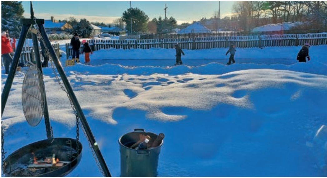
Skøytebanen har i vinter vært et populært sted for barn i området.