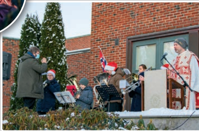
På den andre gudstjenesten spilte Nanset skolekorps til allsangene.