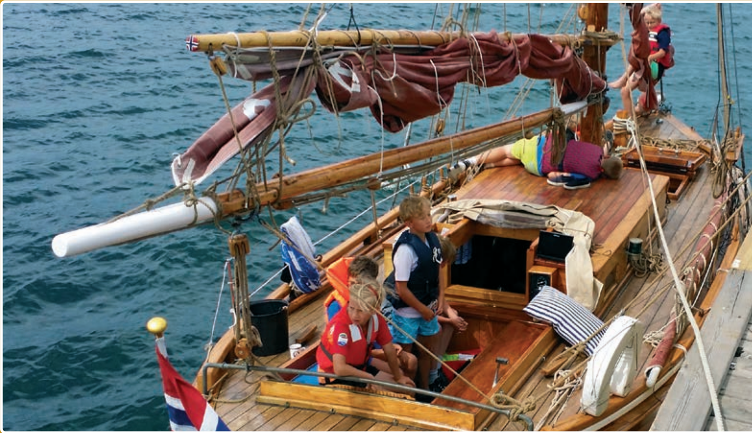
Bilder fra tidligere års feriekubb.