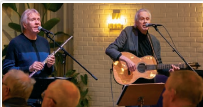
Hes og Gregers sang blant annet «Fall til ro».