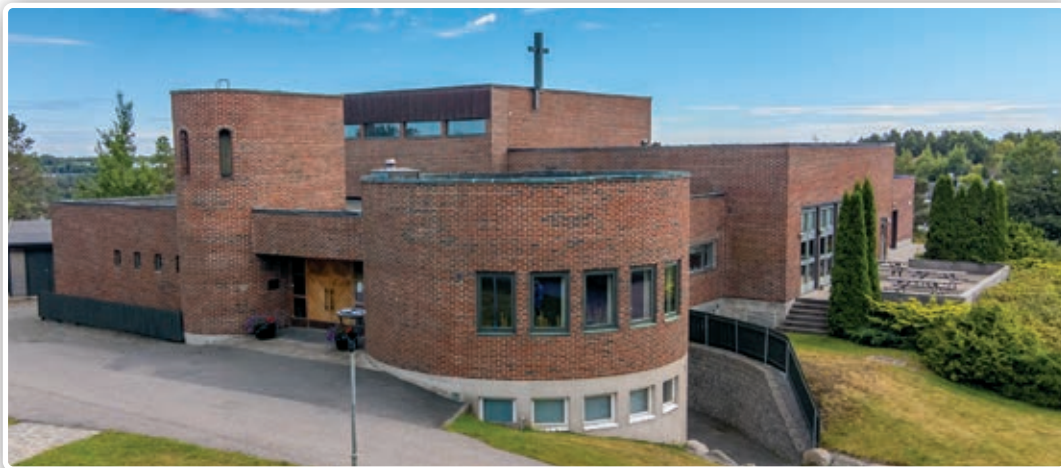
Det er 50 år siden Nanset kirke ble bygd på Hovland.