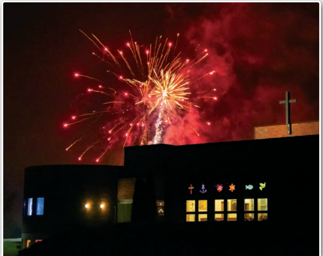
8.-17. mars feirer Nanset kirke sitt 50-årsjubileum.