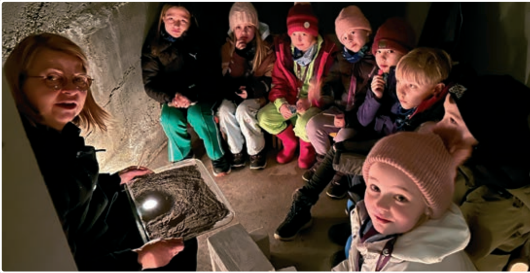
Tårnagentene nede i det innerste dypet av kirken.