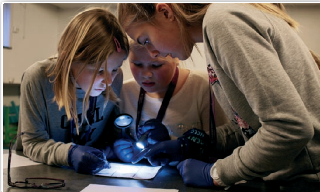
Med lupe og detektivarbeid skulle mysteriene løses.

En særdeles lydhør forsamling fulgte spent med da Arne politimann fortalte om tyveriet av maleriet i Larvik kirke og hvordan politiet hadde løst mysteriet. Så fikk vi også prøve oss på detektivarbeid; med