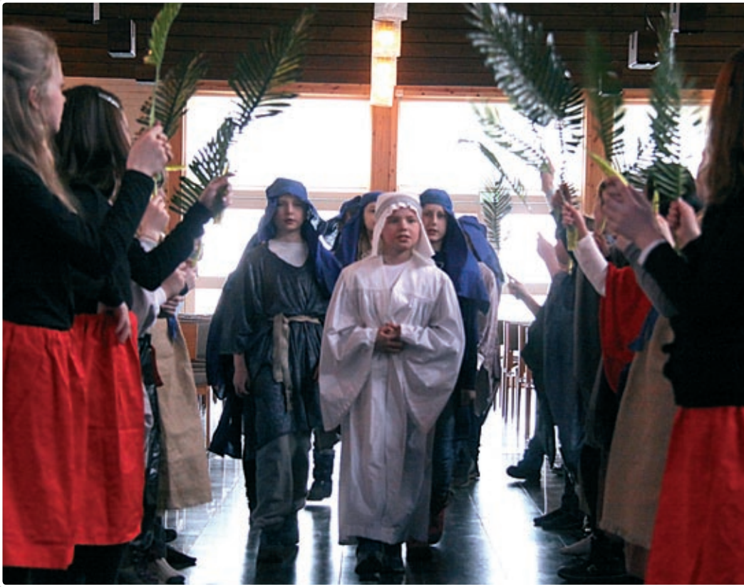
Jesu inntåg i Jerusalem palmesøndag. Scene fra fjorårets skolegudstjeneste.