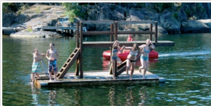
Fine bademuligheter på Oksøya.

på 4-manns rom. Alle rom har servant med varmt og kaldt vann. Toalett og dusj i gangen.