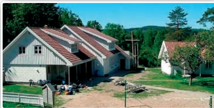
Oksøya leirsted eies av Normisjon.

Leirstedet er bygd for sommerbruk og har stort uteareal med fotballbane, volleyballbane og badestrand. Leirstedet eies av Normisjon. I hovedhuset er det, foruten kjøkken og spisesal, peisestue og aktivitetsrom m/innebandy og bordtennis. Stedet har to internatbygg med til sammen 94 sengeplasser- vesentlig