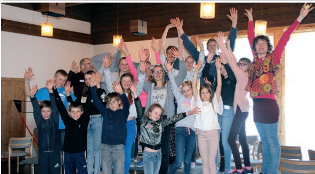
Kode B-gjengen hadde en flott helg i Nanset kirke med mange opplevelser.