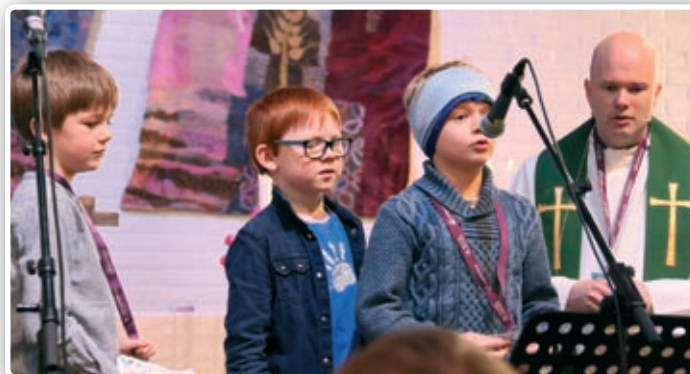
Tårnagentene deltok på søndagens familie-gudstjeneste.

På søndag var det familie-gudstjeneste der både tårnagentene og senior-agentene bidro. Helgen håper og tror vi har satt gode spor – i både agenter, så vel som senioragenter og andre ledere. ■