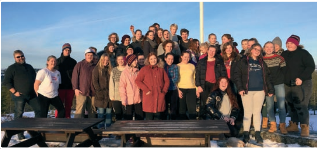
Deltakerne på ungdomsledersamlingen på Blestølen.