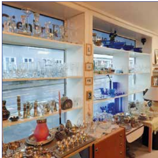
Stort utvalg av fine varer!

Det er med stor glede vi kan fortelle at i sommer har det vært rekordsalg ! Vi er nå fire stykker på jobb hver dag. Mandager har vi stengt for å vaske, rydde, fylle på og ta imot varer. Ellers har vi åpent hver dag fra 11-16, lørdager 11-14.