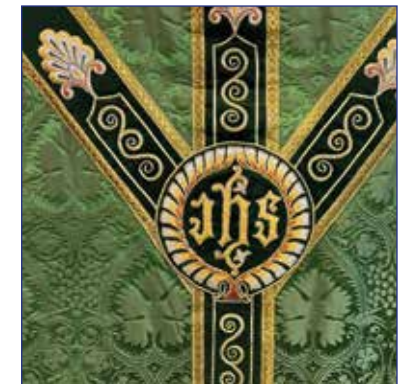
Bildene viser front og rygg