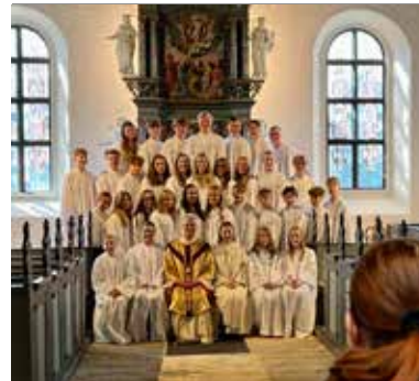
Årets konfirmanter fotografert foran kirkens flotte altertavle.

Unge talenter Vi har vært så heldige å ha med oss talentfulle ungdommer på flere av gudstjenestene våre. Det er vi takknemlige for.