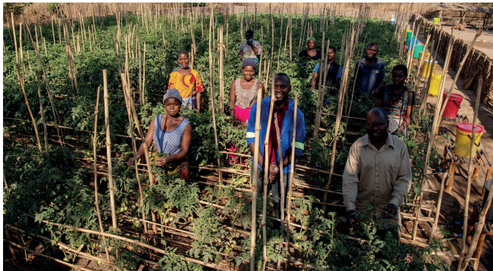
Nye metoder: Agronomen har ansvar for 17 områder med 12 bønder i hvert område. Han lærer dem om nye metoder og hvordan en får mest ut av grønnsaksåkeren sin.

investert i et sett med kvalitetsfrø, et vanningsssystem og gjødsel. I tillegg lærer de seg gode metoder for å utvikle jordbruket sitt.