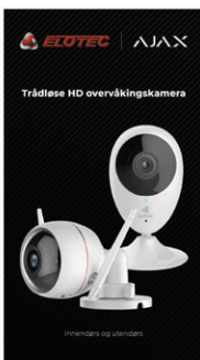
Kameraovervåking og de fleste type alarmer.