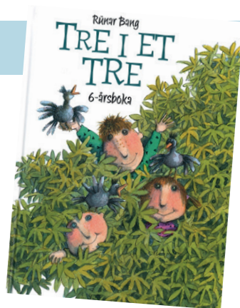
Boka anbefales på det varmeste! Ta kontakt om du har en førsteklassing som ønsker å få boka på etterskudd.