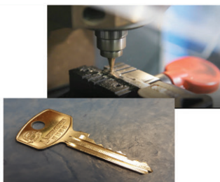
Sliping av de fleste type nøkler. Husk at du alltid må ha minimum én reservenøkkel.