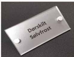
Navnsskilt, postkasseskilt og gravering på de fleste type materialer.