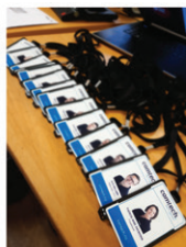
ID-kort, adgangskort og betalingskort.