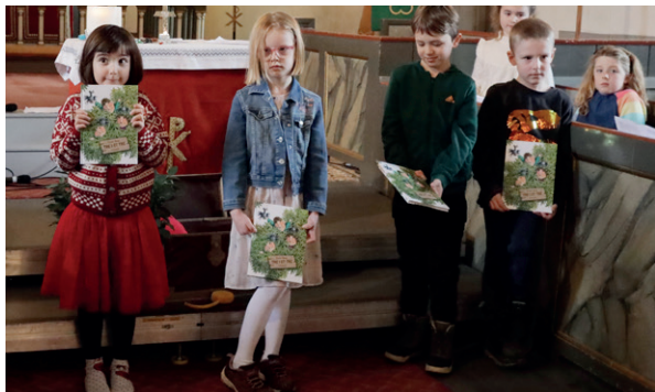
Her er noen av dem som fikk boka utdelt i kirken.