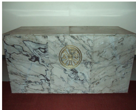
1960: Det nye alterbordet med marmorstein fra Gjellebekk