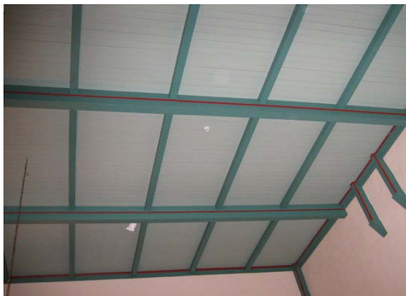
Taket ble senket 5 m og malt på nytt til 100 års jubileet.

Kirken fikk nye inngangsdører, himlingen ble senket 5 meter og ligger nå som et vannrett trehimling på langsgående ribber over loftsbjelkene. Vinduene ble senket og gjort smalere, de fikk brent blyglass innvendig og tykt vanlig glass utvendig. Ny prekestol ble plassert i nord med direkte inngang fra sakristiet og koret fikk nytt alter i slipt i Gjellebekk marmor.