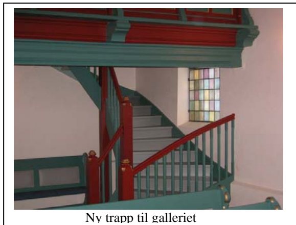
Ny trapp til galleriet

Prekestolen ble flyttet tilbake til sin opprinnelige plass på høyre side under korbuen, og døpefonten er flyttet til venstre i koret. Det ble laget nytt toalett og i prestesakristiet ble det lagt inn vann og montert benk med oppvaskkum. Kirken fikk ny lesepult og ny rød løper på gulvet. Det ble gjort store forbedringer med kirkens lyssetting.