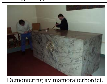
Demontering av mamoralterbordet.

Kirkens opprinnelige alter ble malt i kirkens farger og satt tilbake i kirken i 2002.