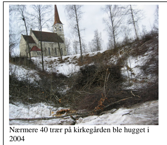
Nærmere 40 trær på kirkegården ble hugget i 2004