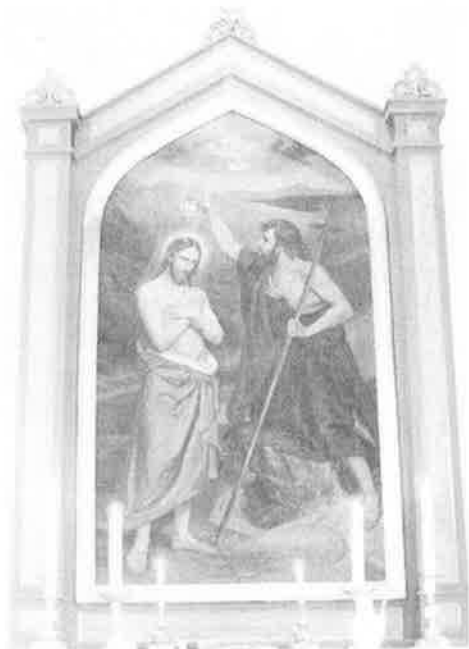
Alttertavlen er fra ca. 1892 og er en reproduksjon etter Tidemand.

En del av inventaret i Tranby gamle kirke fikk plass i den nye kirken. Alttertavlen er allerede nevnt. Den måtte senere vike plass for en ny og større tavle, og er nå på Drammen Museum hvor den har en sentral plass i museets kirkeavdeling. Den gamle kirken hadde to klokker. Den ene, som er støpt i 1599, ble overført til den nye kirken. Denne