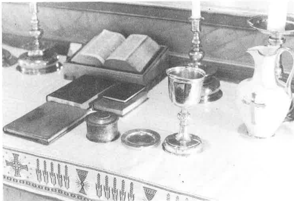
Parti fra alteret.

Vi må heller ikke glemme Guds krav til alle oss som vil stille under Kristi kors, At forbønnen er et virkemiddel ingen kan ta fra oss, forbønn er også verdens håp, den møter oss ved vår dåp. Be for dem som formidler ordet, og for dem som søker, at de finner vei til natverdsbordet. Det er mulig, at mange ved din bønn får bud, og for deg selv, føler du deg nærmere din Gud. Så vil jeg takke for meg selv for tjenesten ved orglet i 32 år. For rike ord fra prekestol, og ved knefall der ved altergang. Og så den kjære klang, ved menighetens salmesang. Ja, takk for alt vår Herre gjennom kirken har oss givet. i kjærlighet og omsorg gjennom livet Velsign så Gud vår kirke og hellige sitt ord at evigheten sikres ved fedres kirkespor.