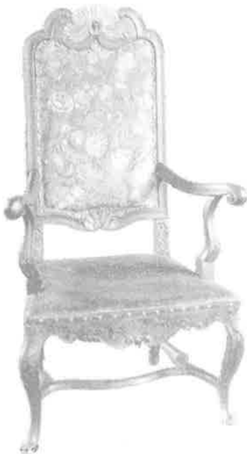
Gyldenlærstol i Tranby kirke

Den gamle, vakre gyllenlærstolen som har plass i koret, kjenner vi ikke historien til. Kirkens lysekroner er ikke like gamle, men er alle kjøpt for midler som er gitt av Kirkeforeningen og private. Det samme gjelder de syv lampettene som er kommet til i de siste årene. De vakre korstolene med rødt plysjtrekk er anskaffet etter en innsamling i 1944.