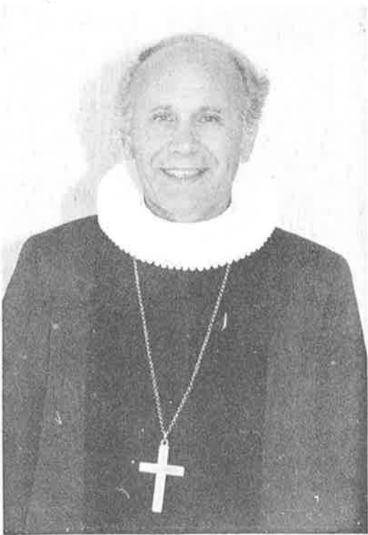
Hilsen fra biskopen i Tunsberg