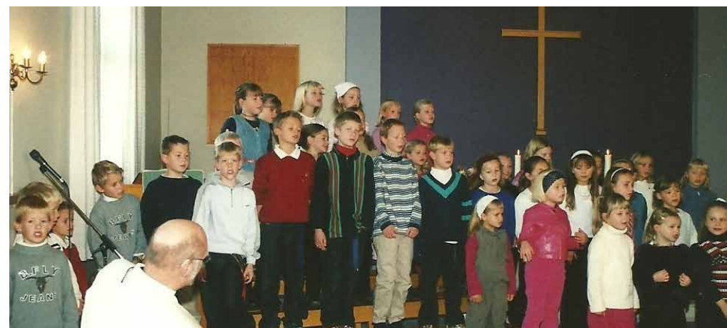
Barnegospelkoret Libagos startet våren 1996 og var aktivt til 2008. Dette bildet er fra 2001.