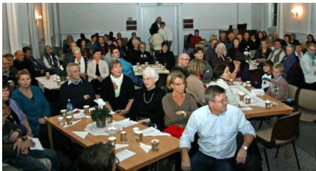
Søndag 15. november 2009 var kirken fylt til siste plass for å høre liungen, artist og TV-programleder Jan Erik Larssen.