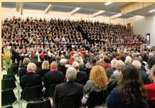
Over 1000 mennesker deltok på festkvelden

Det var det Finlands-svenske korforbundet som var vertskap og i Vasa by er omtrent 30 % svensktalende. Det gjorde kommunikasjonen enklere. Alle deltakerne hadde forberedt et felles program med hjemmefra og programmet vekslet det mellom konserter, seminar og samlinger. Med tilbake har koret mye nytt stoff og impulser som