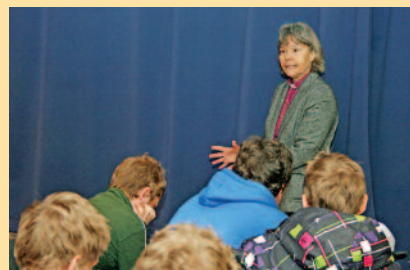
Møte med ungdomskoleelver på Tranby, Lierbyen og Stoppen ungdomsskole

Hun har møtt frivillige og ansatte, vært på skolebesøk til alle de tre ung- domsskolene i kommunen, besøkt