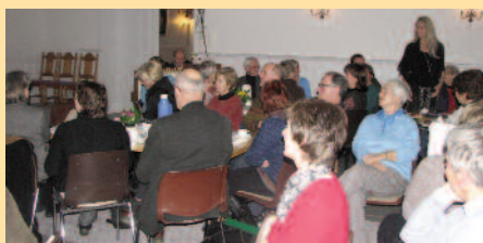
Mange deltok på møte for frivillige medarbei- dere i Frogner og Tranby på Lierskogen kirke

kirken er synlig til- stede viser at kirkens Herre, Gud selv, er til- stede med lys og håp i verden, og at vi er for- sonet med Gud. Besøket ble avsluttet i et fullt besatt Tranby menighetshus. I sine til nå førti bispe- visitaser, hadde hun aldri sett flere til avsluttende kirkekaffe enn i Tranby. At kirken er viktig i lokalsamfunnet har vi sett klare eksempler på i det siste. Den triste kirkebrannen i Hønefoss har vist at kirkehuset er viktig for mange enkeltpersoner. På Lierskogen har kampen for å bevare og fornye et kirke- hus som var truet av nedleggelse, mobilisert frivillige til en enestående dugnadsinnsats for kirka si. Dette viser at mange har et sterkt eierforhold til sin lokale kirke. Det er noe forunderlig med dugnadsinnsats. Det utløser handling hvor folks ulike kompetanse blir etterspurtd. Det er noe eget med kirketilhørigheten når den kommer inn både i hjerte og never.