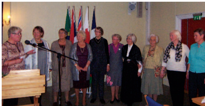
Medlemmene i misjonsforeningen 2013 inviterer nye til å bli med

Ikke alle misjonsforeninger overlever stifterne sine, men misjonsforeningen i Frogner har holdt det gående uavbrudt siden 1878. Det er det få i distriktet som kan slå dem på, og det fortjener feiring. I et