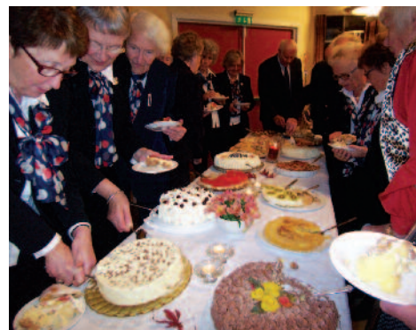
Fra jubileumsfesten. Misjonsforeninger kan dette med god servering.

I en tid hvor foreningsliv ofte handler om "hva er det jeg kan få ut av dette", så er det befriende å møte en levende tradisjon for et foreningsliv som er der for at andre skal få et bedre liv.