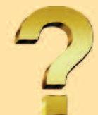
Menighetspedagog (Sylling og Sjåstad)