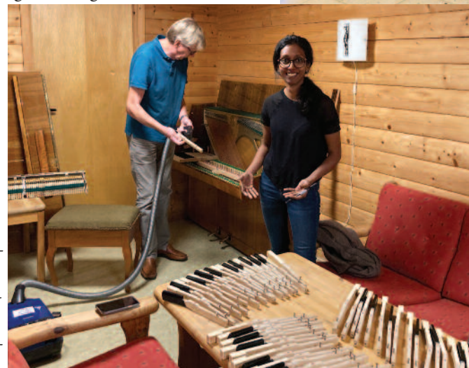
Tangenter til tangtaksjon