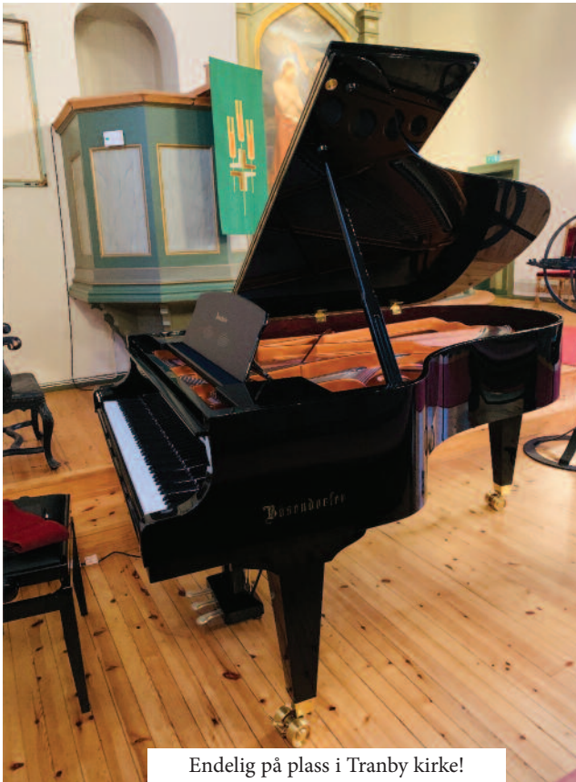
Endelig på plass i Tranby kirke!

Planen er å ha en innvielseskonsert i september, når vi kan møtes uhindret igjen, hvor vi virkelig kan feire flygelets ankomst og at dets musikalske "liv" kan få begynne.