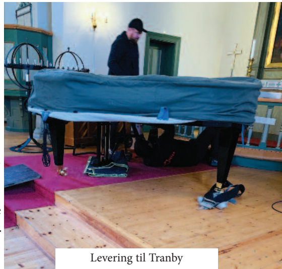
Levering til Tranby