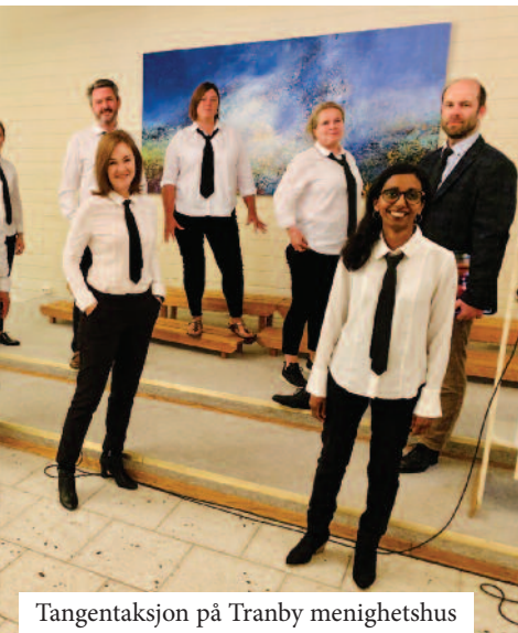
Tangentsjon på Tranby menighetshus

Søknadsskrivingen ble satt i gang av undertegnede og den ble grundig lest og sjekket av teamet. Mange møter og planlegging med komiteen ble utført. Deretter ble den første søknaden og budsjettering sendt til Einar Juels legat i mai. Svaret kom, vi fikk 100.000,-! Tidlig på høsten ble det sendt en søknad til Sparebankstiftelsen og vi måtte belage oss på å vente helt til desember før svaret skulle komme. Imens kom den gode idéen om en tangentsjon kombinert med en konsert frem, videohilsner fra pianister verden rundt på