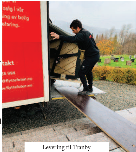
Levering til Tranby