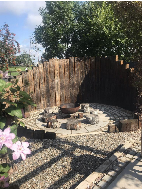
Figur 4, eksempel en svillevegg

Det kan nå bygges en vegg av brukte sviller som navneplatene skal monteres på. Det blir en åpning på 17cm mellom svillene. Svillene inneholder ingen giftige stoffer. Til sammen blir det mulig å montere 432 navneplater. Dette vil være tilstrekkelig for mange år.