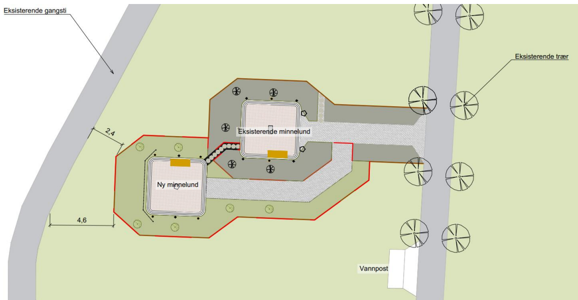
Figur 1, forslag vedtatt i sak 9/22.