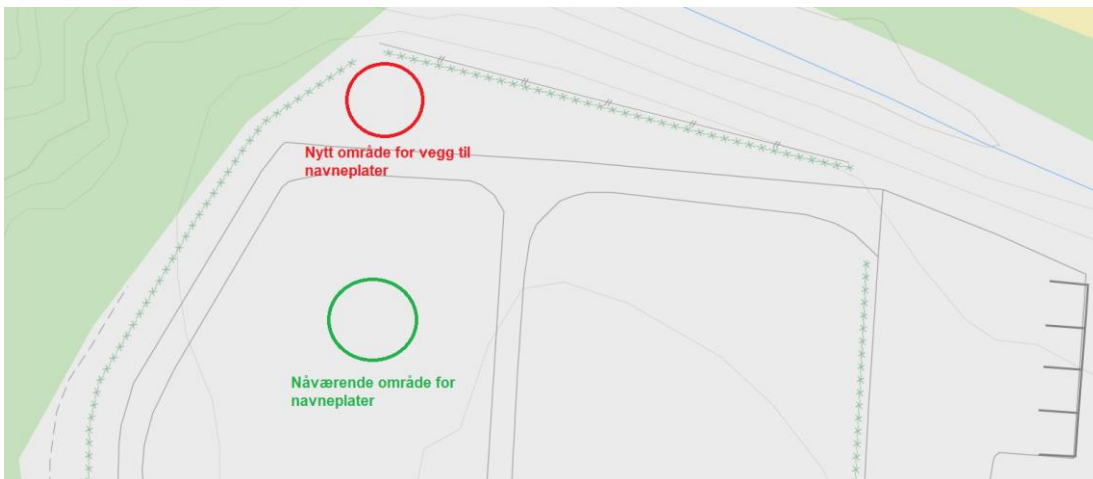
Figur2: Nåværende og nytt område for plass til navneplater