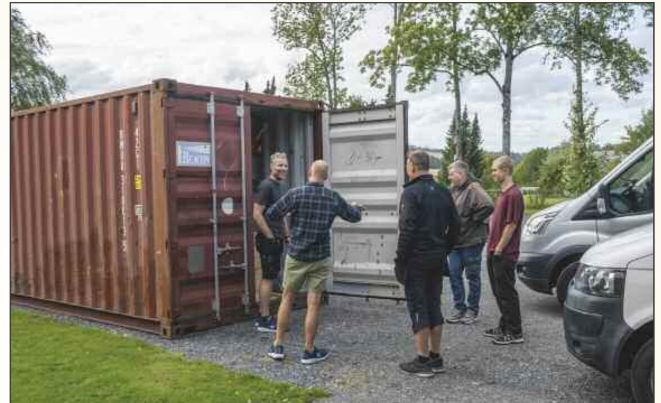
Orgelet kom til Fet kirke 26. august fra fabrikken i Danmark i to store containere. Ansatte i TH. Frobenius & Sønner orgelbyggeri, som bygger orgelet, bar alle delene inn i kirken. Hjemmesiden til orgelbyggeriet er: https://www.frobenius.no