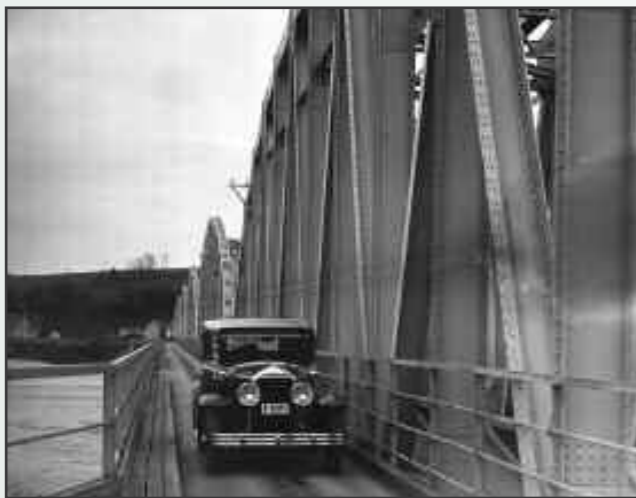
Fetsundbrua slik den så ut under krigen før bilveien ble revet.

To lastebiler ble benyttet pr. transport. Opptil 20 mennesker ble stuet tett sammen på hvert lasteplan, med kun en skarve presenning som eneste "sikkerhet" og gjemmeded. Jeg siterer fra Hilde Vesaas sin bok: "Det knaker i plankene på brua idet lastebilen ruller