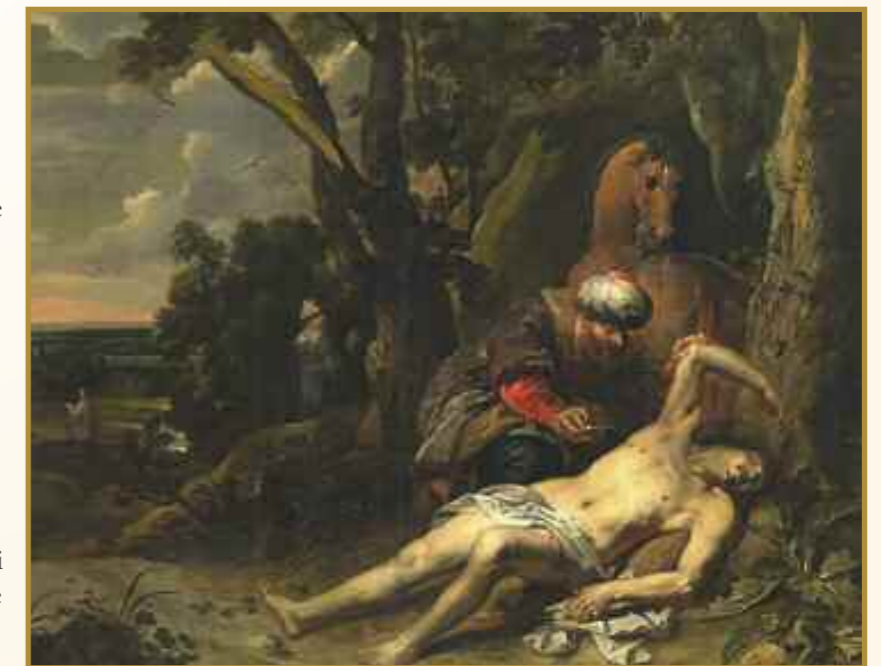
Den barmhjertige samaritan malt av Balthasar van Cortbemde i 1647