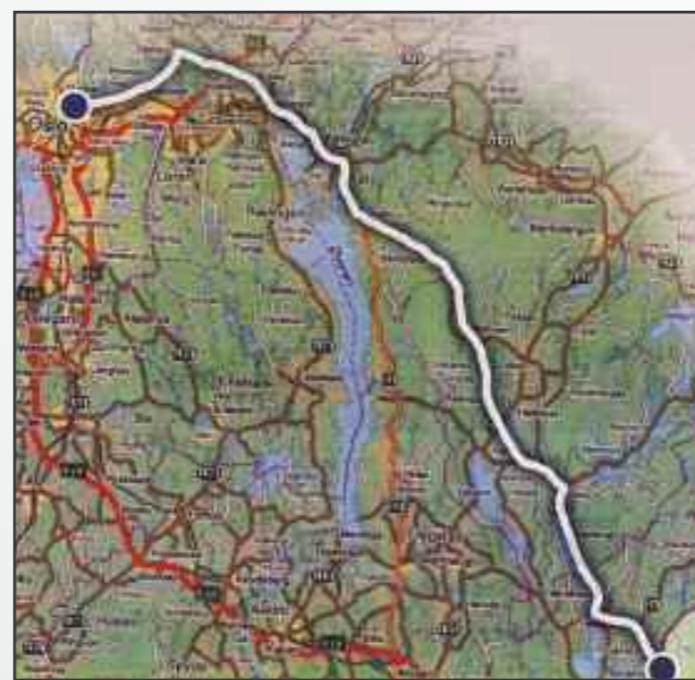
Ruta „Carl Fredriksens transport" fulgte gikk over Gjelleråsen og riksvei 22 til Lillestrøm, gjennom „frihetsportalen" og over Fetsundbrua.