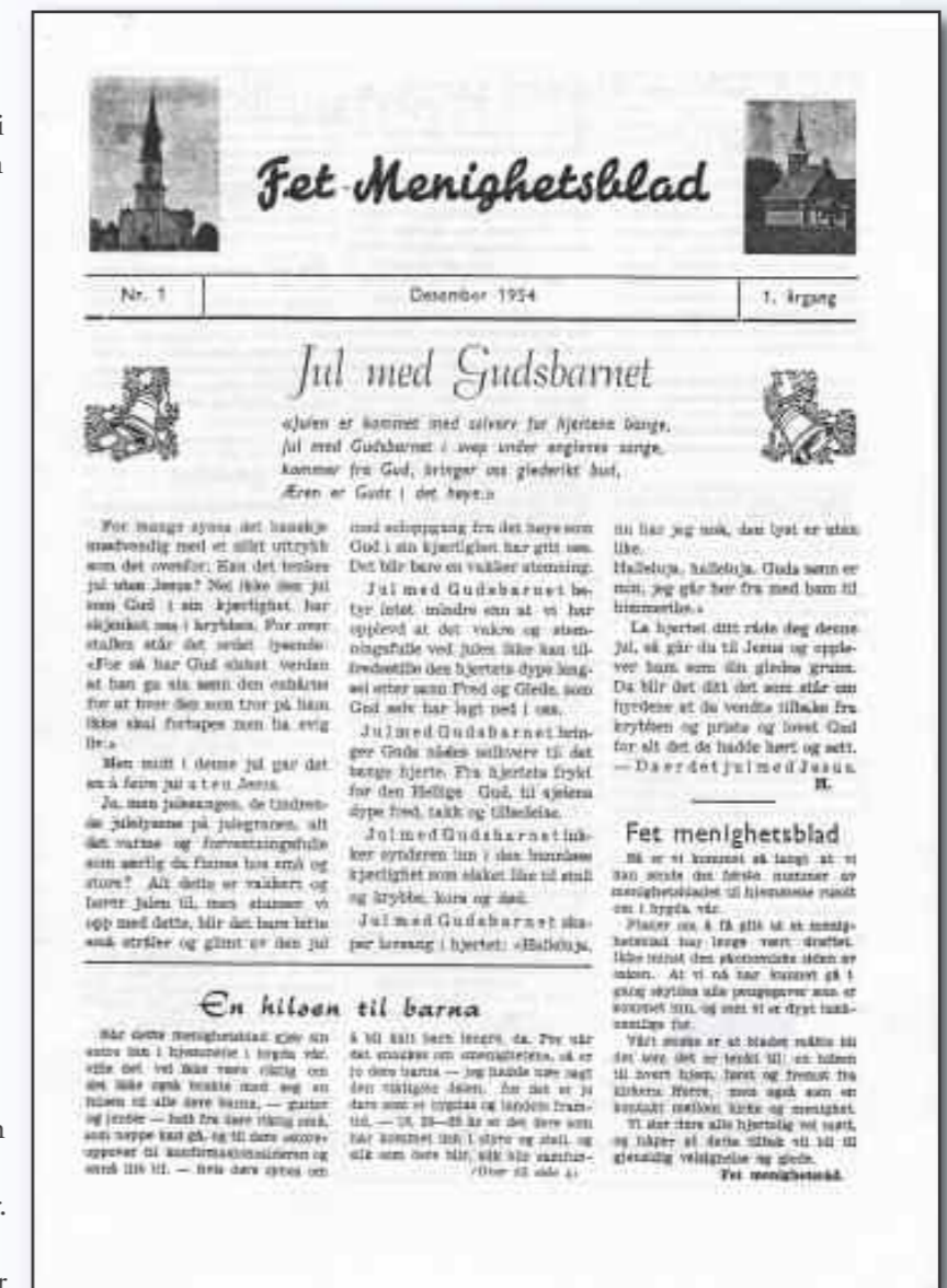
Fet menighetsblad anno 1954