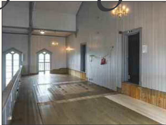
Alt er gjort klart til det nye orgelet på galleriet bak i kirkens

Det nye orgelet ble bygd av dyktige håndverkere og spesialister, slik at vi støtter disse tradisjonelle kunstformene og bidrar til å opprettholde og videreutvikle en unik håndverkskompetanse med røtter i europeisk