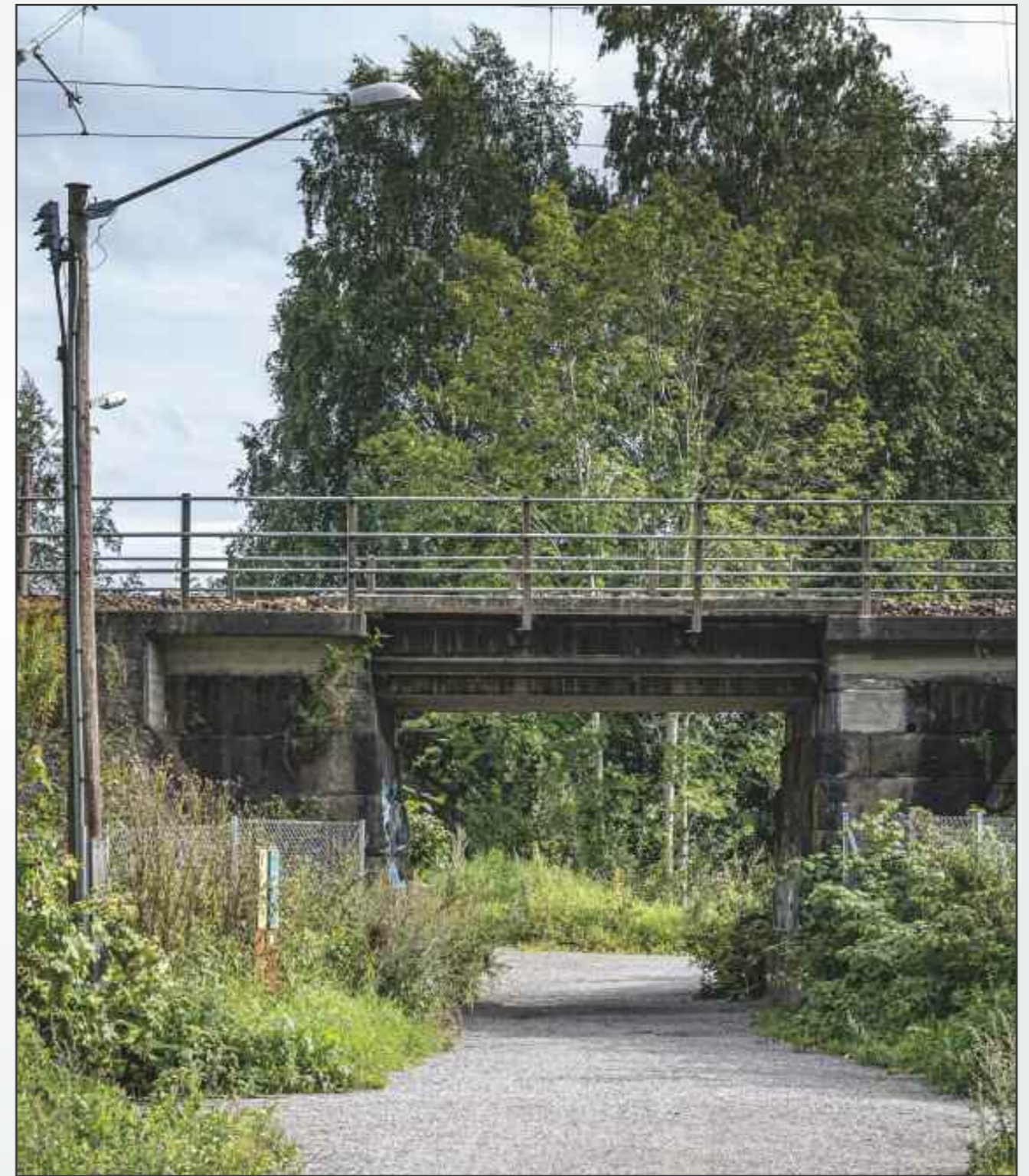
Jernbaneundergangen ved Fetsund ble opplevd som en frihetsportal for de som flyktet til Sverige.