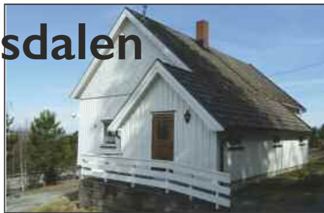
Gansdalen bedehus er blitt baptistkirke

Gansdalen bedehus ble bygd i 1937 og ble innviet søndag 23. januar 1938. Indremisjonens hovedorgan „For fattig og Rik” skrev følgende om innvielsen: