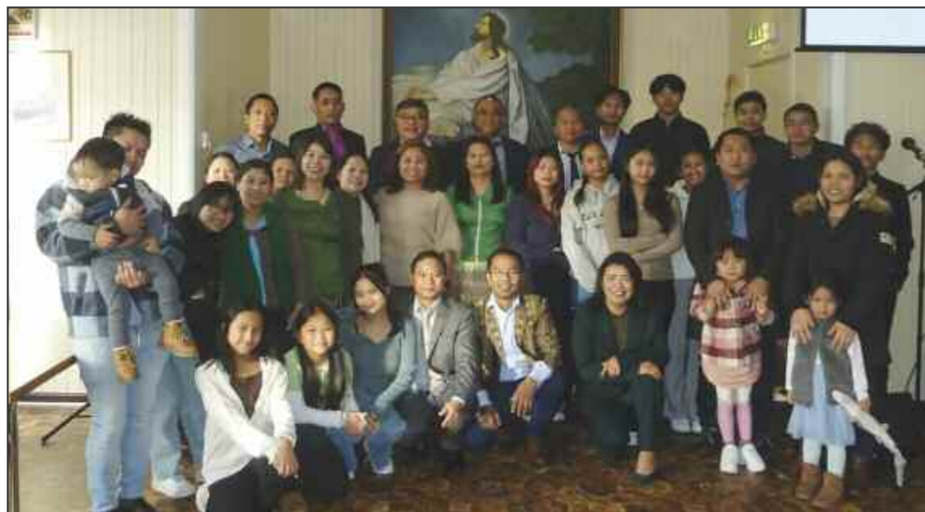
En del av menigheten samlet i sitt nye gudshus. Et hus de er veldig begeistret for. Velkommen til bygda!