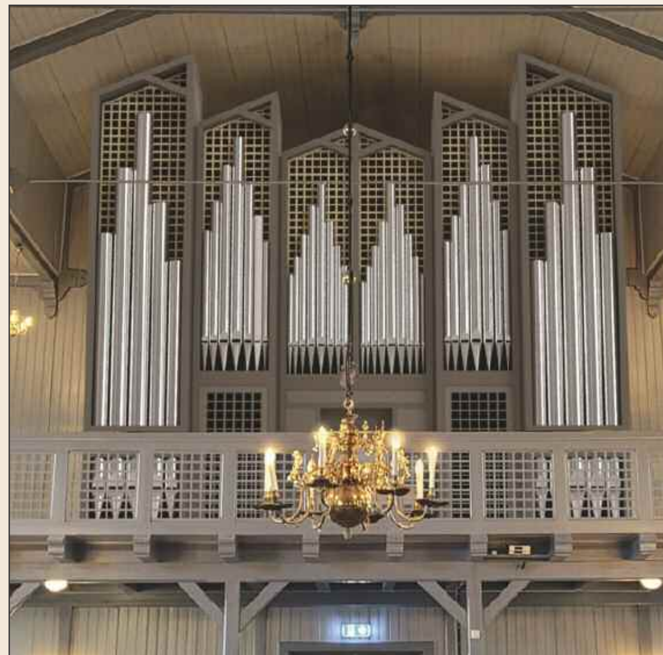
Omtrent slik vil det nye orgelet se ut når det står ferdig i Fet kirke. Gallerikanten vil forbli slik vi er kjent med.