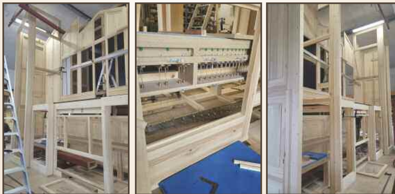
Vårt nye orgel er under bygging på fabrikken i Danmark. Disse bildene er tatt 20.mars.