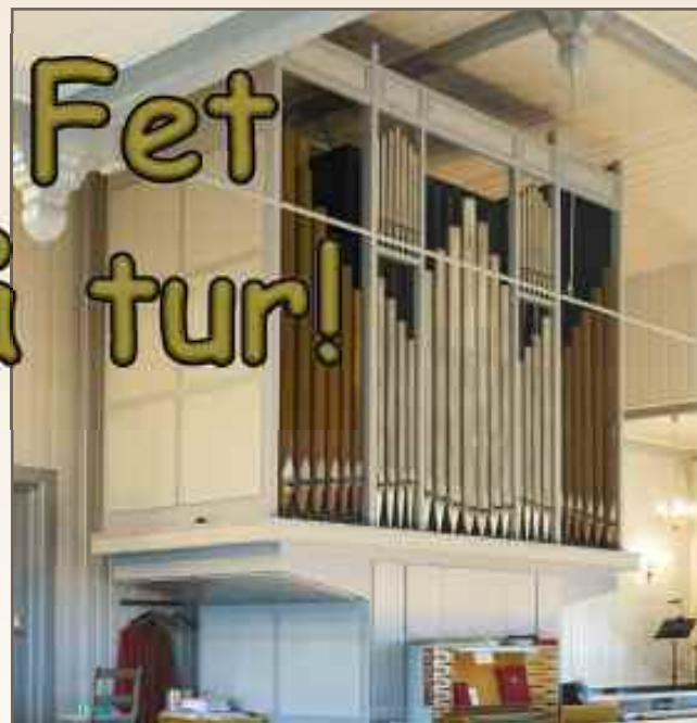
Orgelet fra 1967 skal ut på reise

Følg med på menighetens hjemmeside og på Facebook.