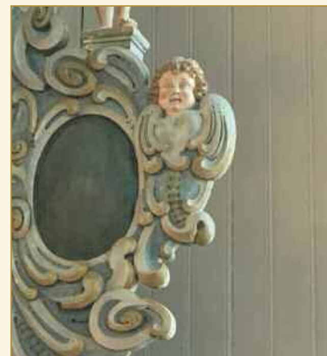
Minner meg om Guds engel. Og betyr mye for meg siden den har røde bollekinn og det minner meg om søte babyer.