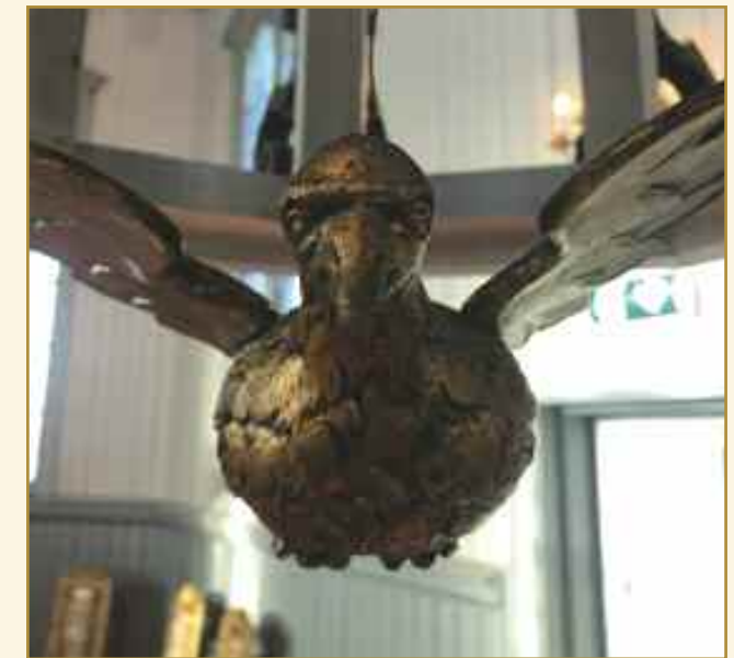
Jeg tok bilde av denne fordi det var det jeg så opp på da jeg ble døpt.