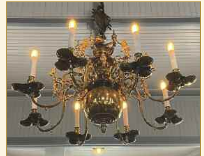
Jeg kan se kirken i den blankpolerte lampen og det er den første jeg legger merke til når jeg kommer inn.