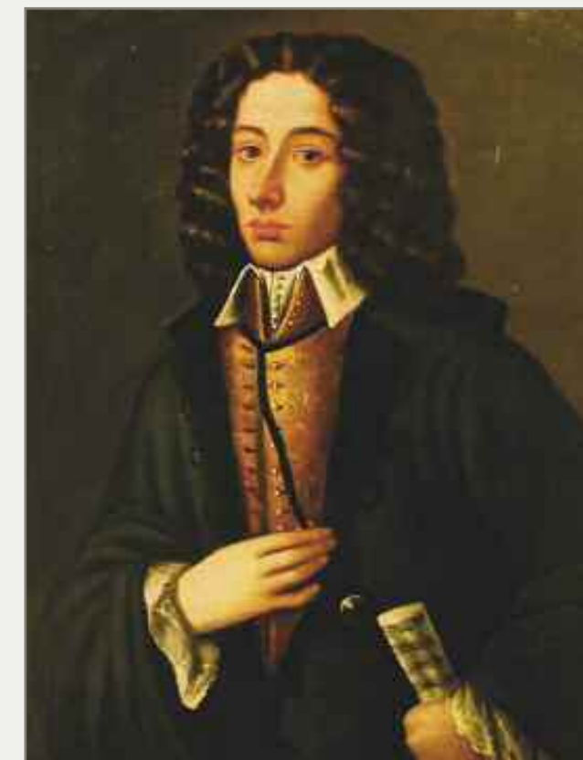
Komponisten Giovanni Battista Pergolesi

Jeg synes det er spennende hvordan den samme teksten kan uttrykkes på mange forskjellige måter med musikk. Jeg håper at spillelisten min på Spotify og påskens tekster kan bidra til refleksjon i den stille uke og for dere hjemme dersom vi ikke kan møtes i kirkerommet.