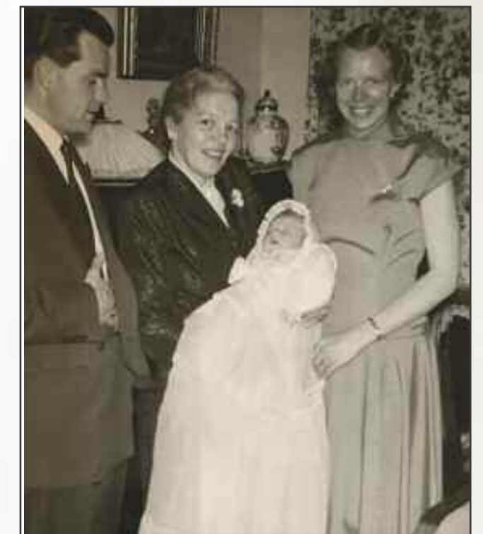
Mormor og meg