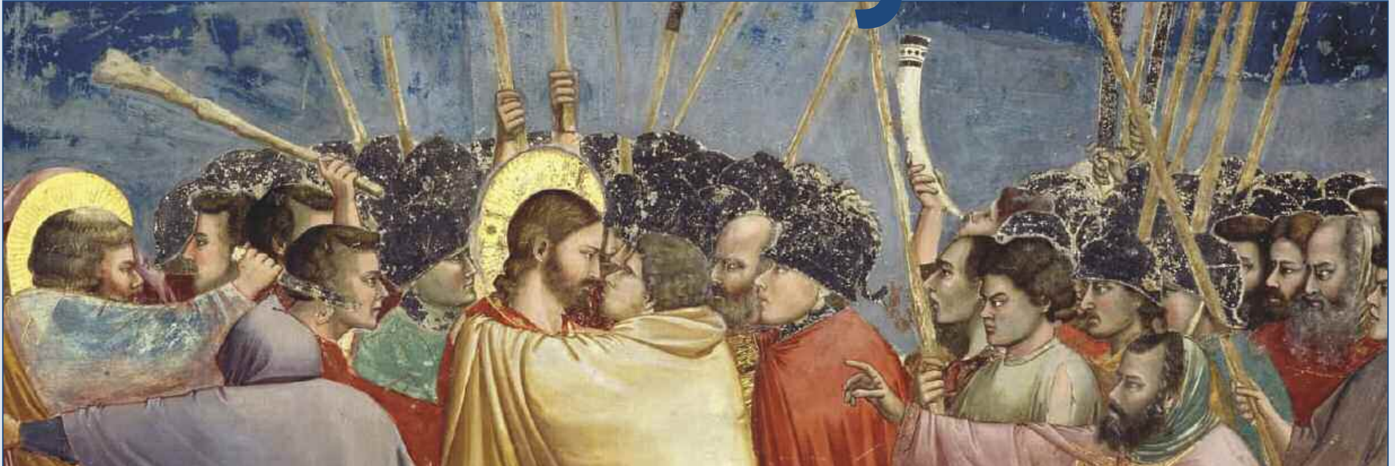
Giotto di Bondone. Judaskysset, Jesus forrådes og gripes, freske i Scrovegnikapellet, Padova, 1304–06.

Vi møter mange forskjellige mennesker i bibelens påskefortellinger, personer som ble innblandet i, og fikk betydning for Jesu lidelseshistorie.