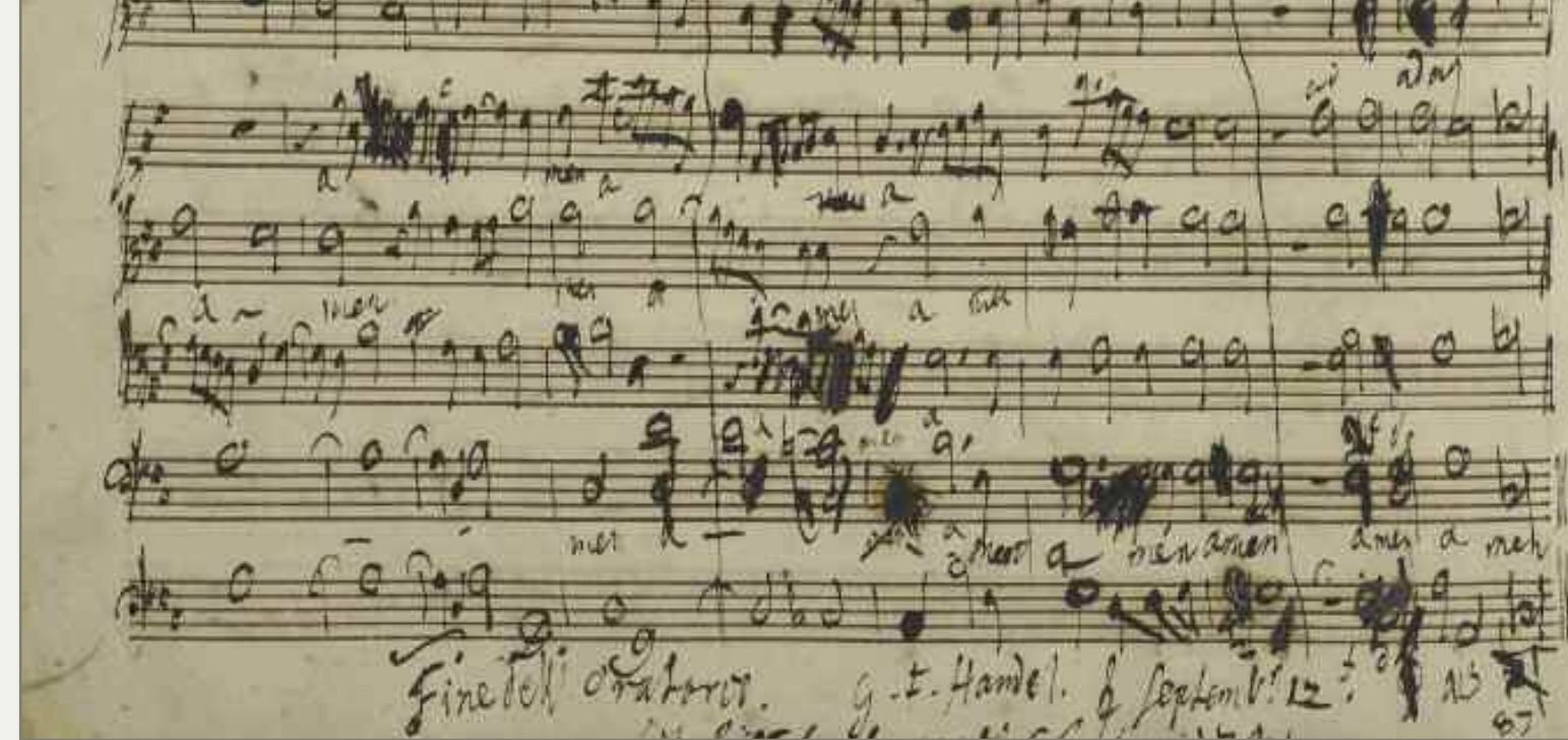
Noter til Händel's Messias

Dette er en hymne av Paulinus av Aquileia fra år 796 og synges i forbindelse med fotvasking på skjærtorsdag.