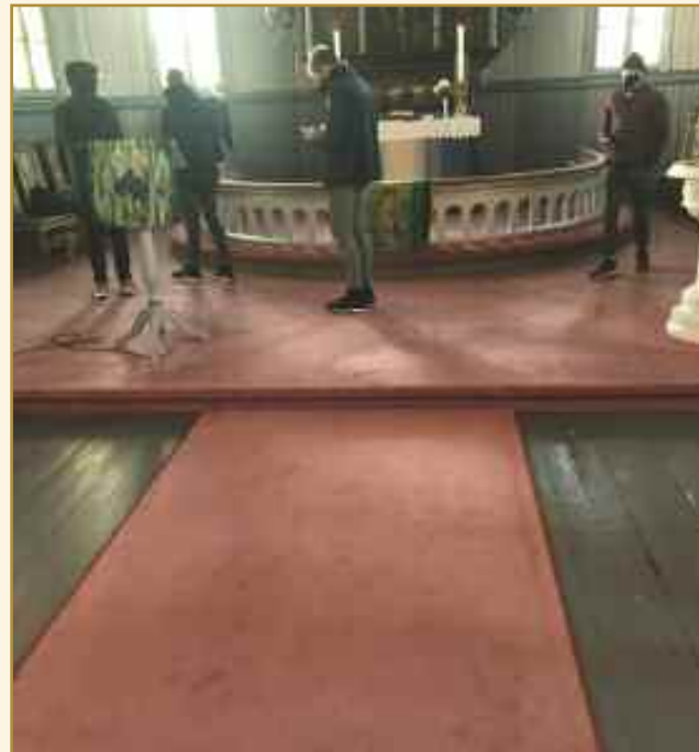
Tok dette bildet pga begravelse. Dette minner meg om min mormors begravelse.