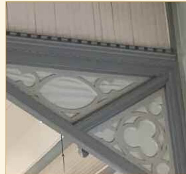
Jeg synes bare dette hjørnet er fint. Legger alltid merke til det.