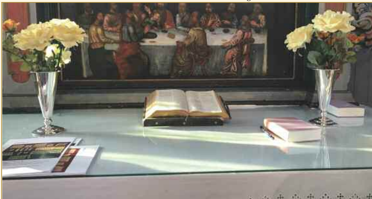
Jeg tok dette bildet av Bibelen fordi det er en historie og en tanke bak alle ordene i boken. Og har et viktig budskap om å inkludere alle.