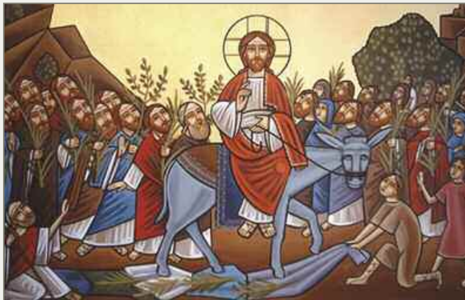
Palmesøndag: Se, vi går opp til Jerusalem.

latin for Hvor kjærlighet og miskunn finnes, der er Gud.