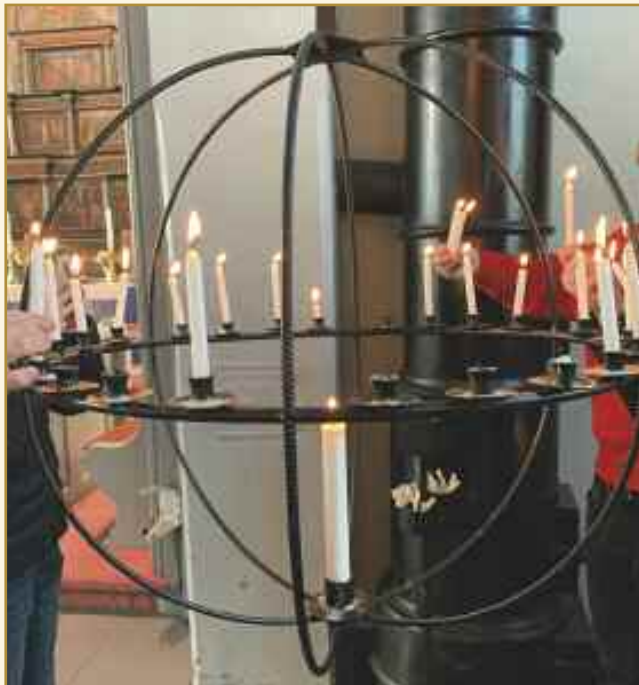
Fordi jeg synes det er fint å tenne lys for noen du bryr deg om.

Konfirmantene fikk dette spørsmålet på årets første konfirmantsamling. De gikk rundt i kirken og tok bilder. De valgte ut et bilde som de sendte til meg med en kort begrunnelse. Kanskje du kjenner deg igjen i bildene og tankene til konfirmantene?