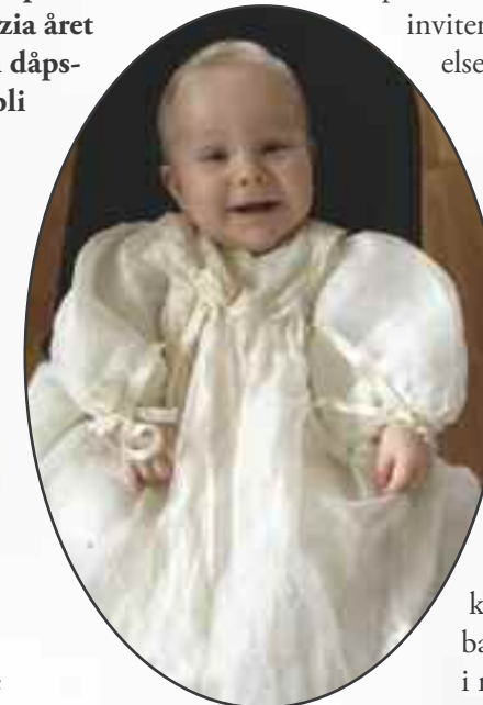
Et nydelig barnebarn