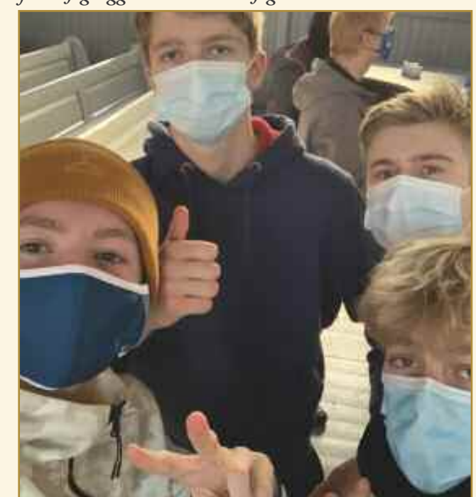
Jeg valgte dette bildet fordi vennene mine betyr mye for meg. Det er gøy i kirka og jeg trives her.