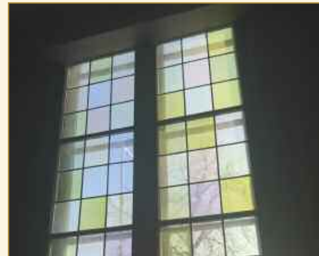
Lyset fra vinduet lyser opp hele kirken.