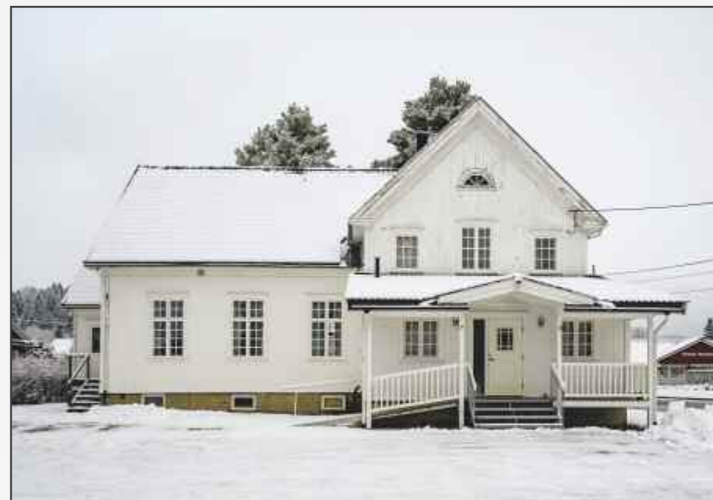
„Misjonshuset” slik det ser ut i dag

Med sine 102 år er Fetsund Normisjon fortsatt en vital og oppegående forening med flere undergrupper som driver et aktivt arbeid knyttet til Misjonshuset.