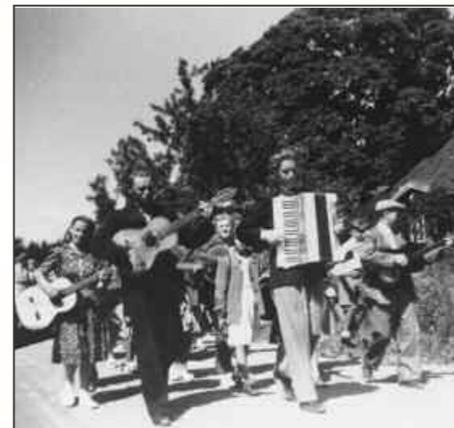
FH-2022-377 Søndagsskolen på tur 1950