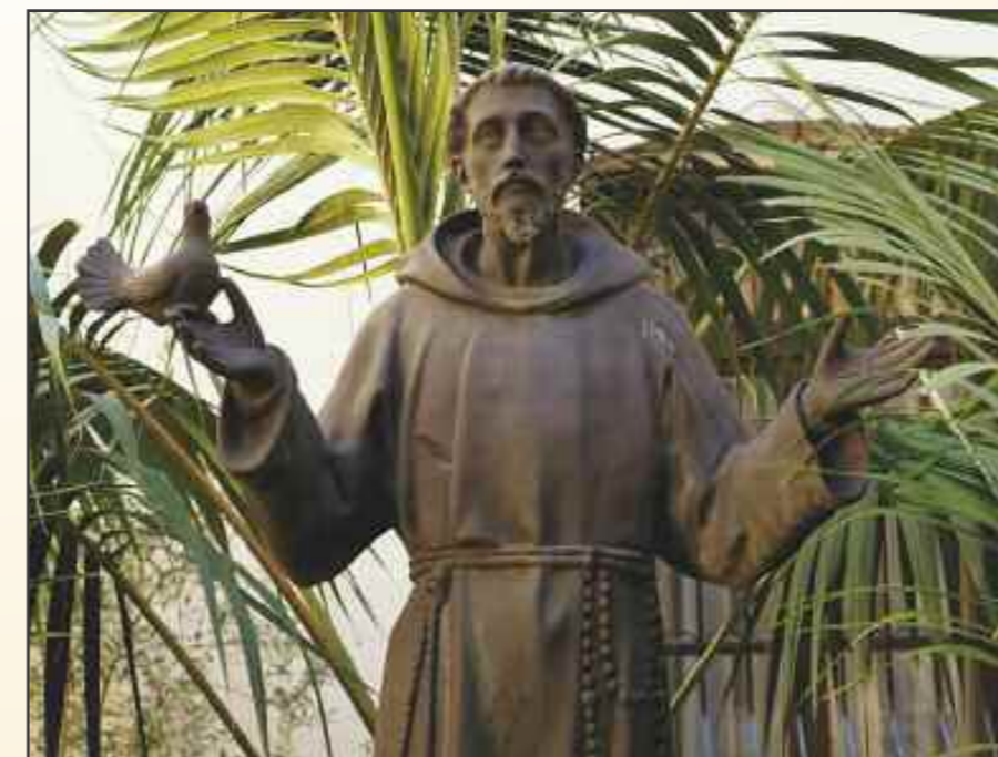
Frans av Assisi.