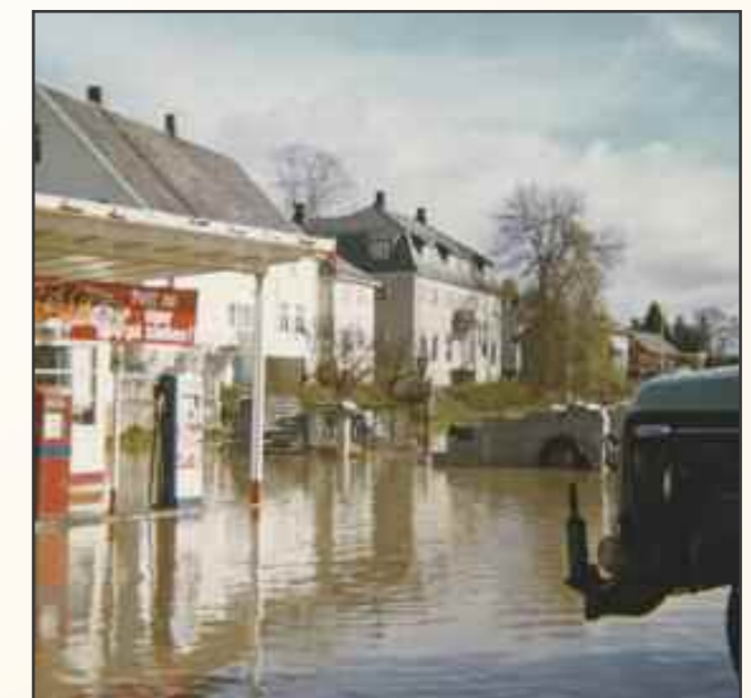
FH-2022-357 Flom 1966 i Fetsund sentrum