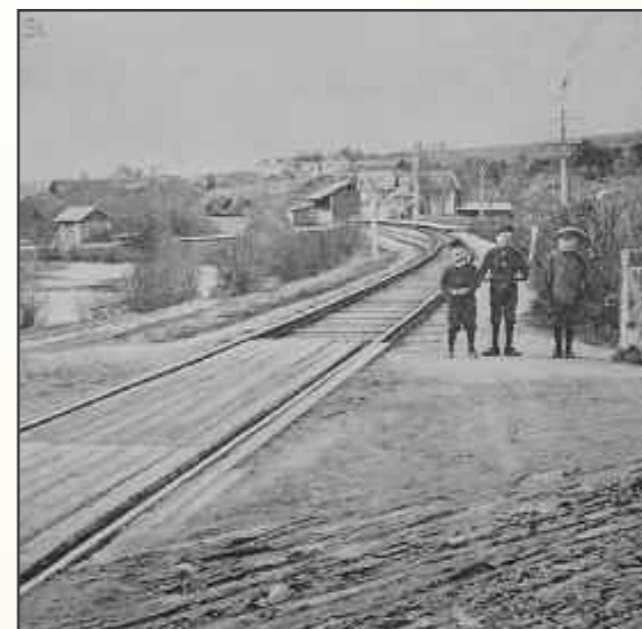
FH-2022-0056 Fetsund stasjon 1916