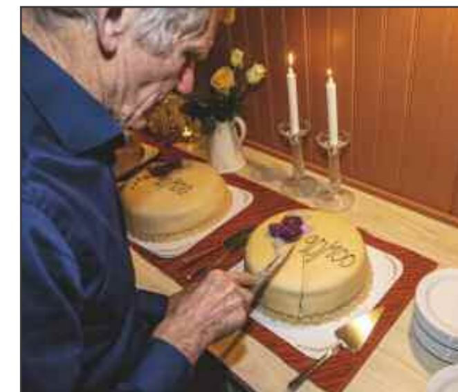
I en jubileumsmarkering hører jubileumskake med

også i dag en livskraftig virksomhet i Fet menighet der medlemmene trofast slutter opp om foreningen.