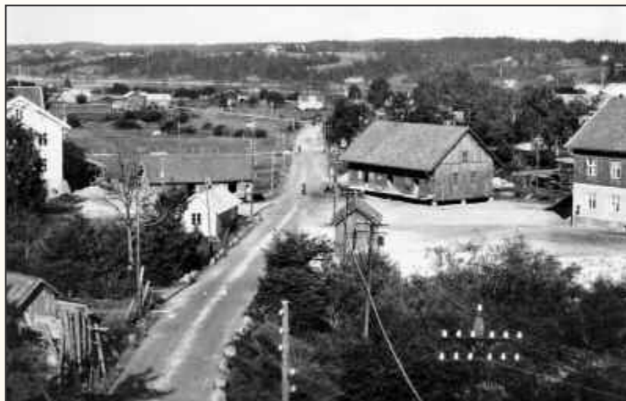
Fetsund mellom 1920 og 1930

Bygging av Misjonshuset kostet både penger og dugnadsinnsats av medlemmene. Det står derfor stor respekt av at den relativt unge foreningen klarte å skaffe seg eget hus i de vanskelige 30-årene.»