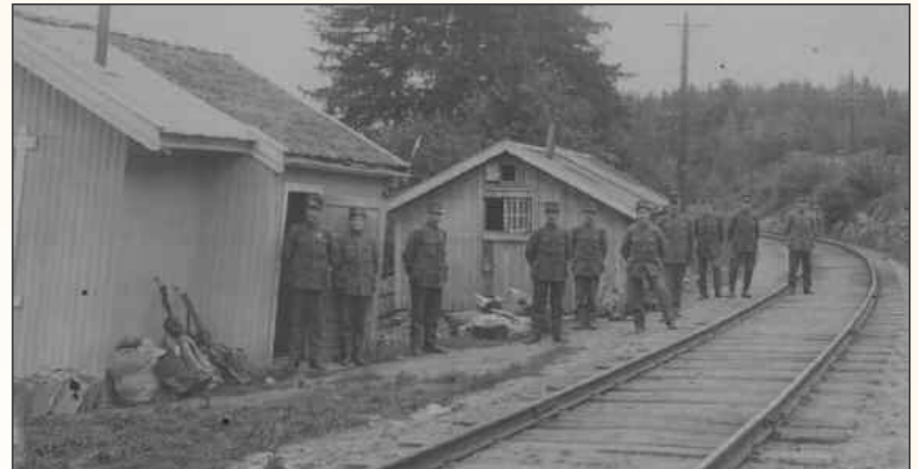
FH-2022-851 Nøytralitetsvakt ved Svingen stasjon 1914-15