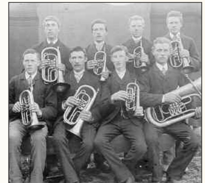
FH-2022-0019 Gansdalen hornmusikk 1893