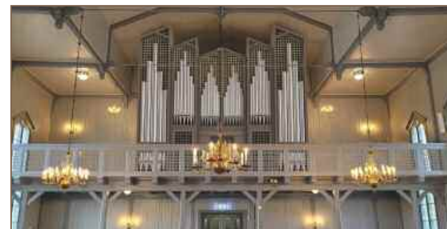
Byggingen av dette vakre orgelet starter i 2024.