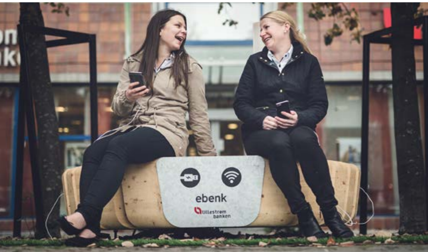
På eBenken utenfor banken på Torvet har du wifi og kan lade din mobil.