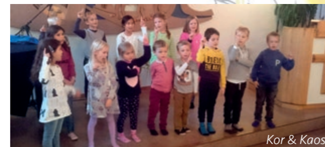
Kor & Kaos