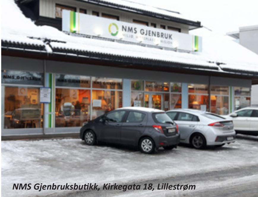
NMS Gjenbruksbutikk, Kirkegata 18, Lillestrøm