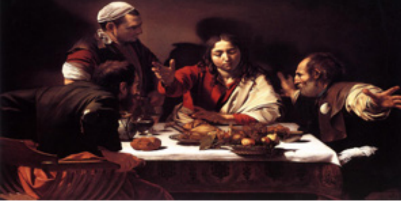
Caravaggio: Emmausvandrerne (1601)