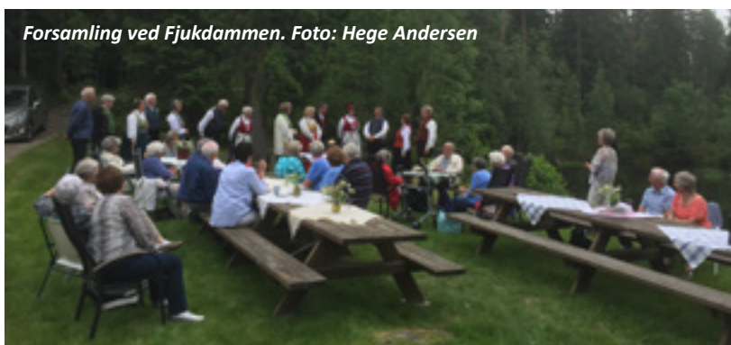
Forsamling ved Fjukdammen.