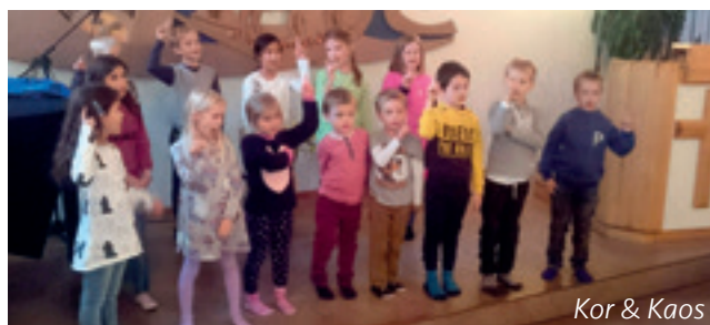
Kor & Kaos