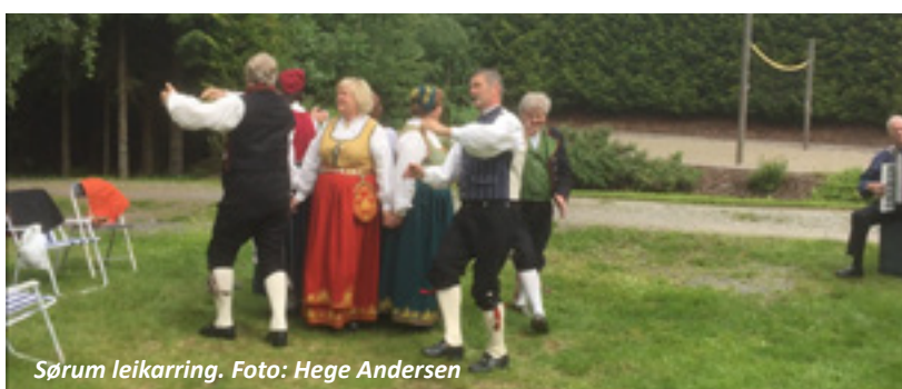
Sørum leikarring.