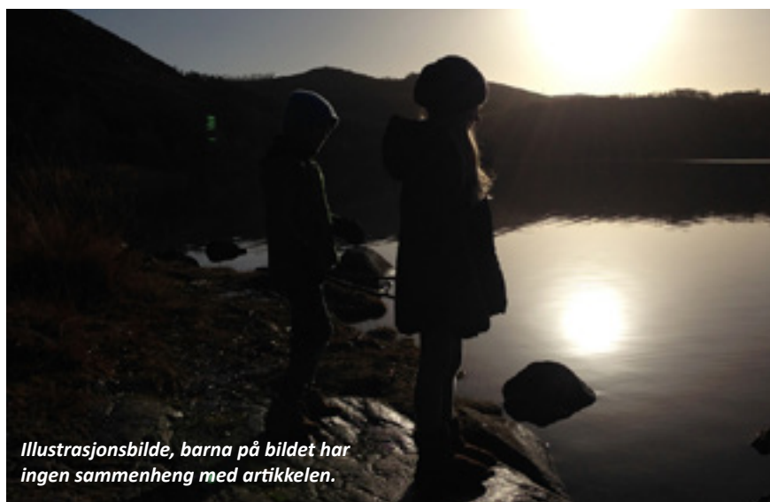
Illustrasjonsbilde, barna på bildet har ingen sammenheng med artikkelen.