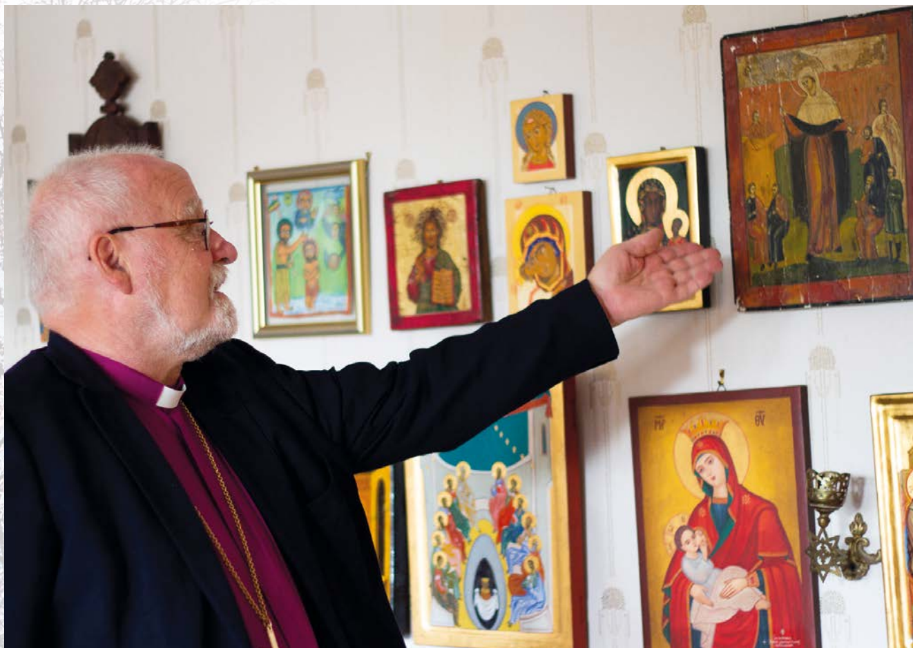
Biskop Sommerfeldt viser fram sin ikonsamling.

Når biskop Atle Sommerfeldt går av som biskop, kommer han aller mest til å savne alle møtene med mennesker.