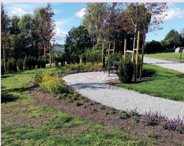
Anonym minnelund.

I Menighetsbladets sommernummer skrev vi om arbeidet med å bygge minnelund ved Frogner kirke. Nå er minnelunden ferdig, det har blitt et fint tilbud ved kirkegården. Se hvordan det ble!