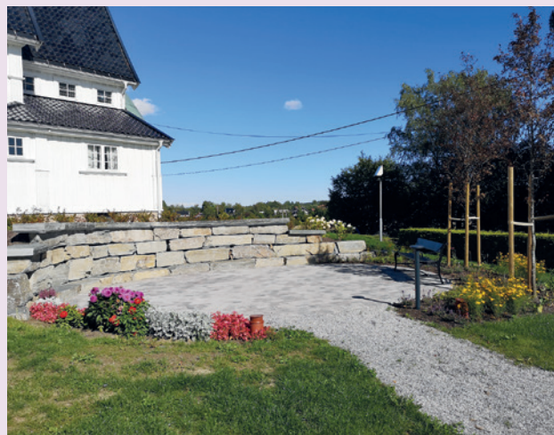
Navnet minnelund.