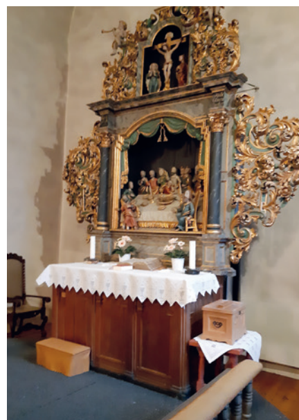
Alteret med alterduken