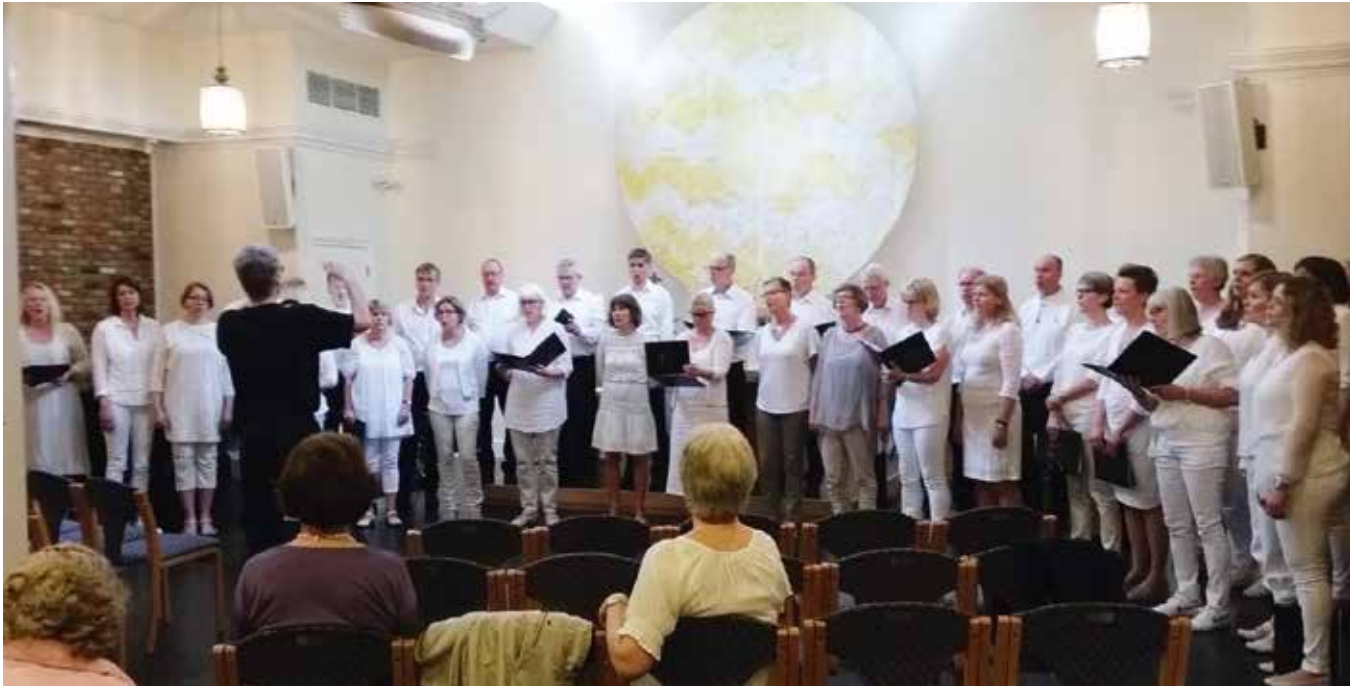
Mandal Kantori synger i Sjømannskirken (koret har hvitt/lyse antrekk)

Den norske sjømannskirken. Her sang vi i selve gudstjenesten, i tillegg til at vi hadde en liten konsert i forbindelse med kirkekaffen i etterkant. Etter en fin stund i sjømannskirken gikk turen til Central Park for piknik i strålende vær. Her prøvde vi oss også som gatemusikanter og fremførte to-tre sanger, til stor