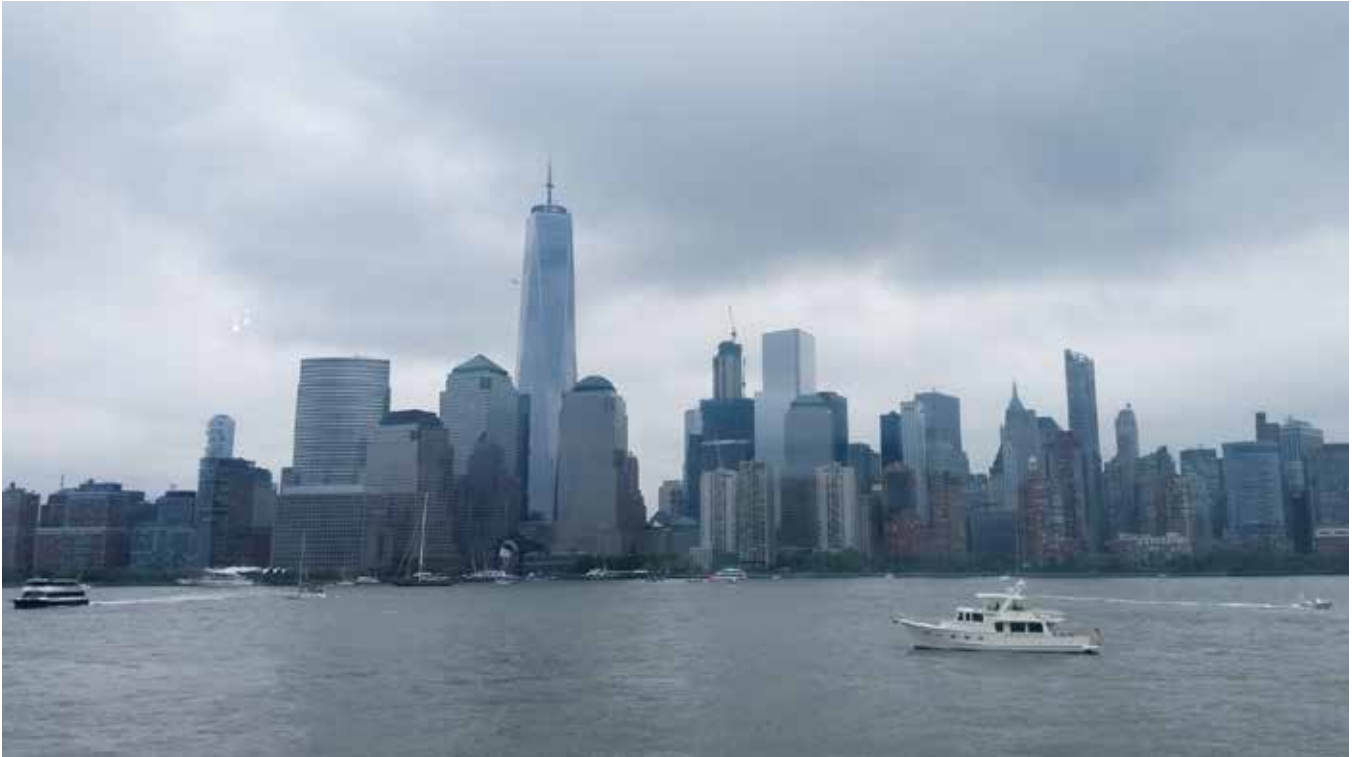
Manhattan Skyline sett fra Hudson River.