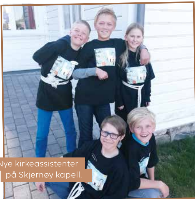
Nye kirkeassistenter på Skjernøy kapell.