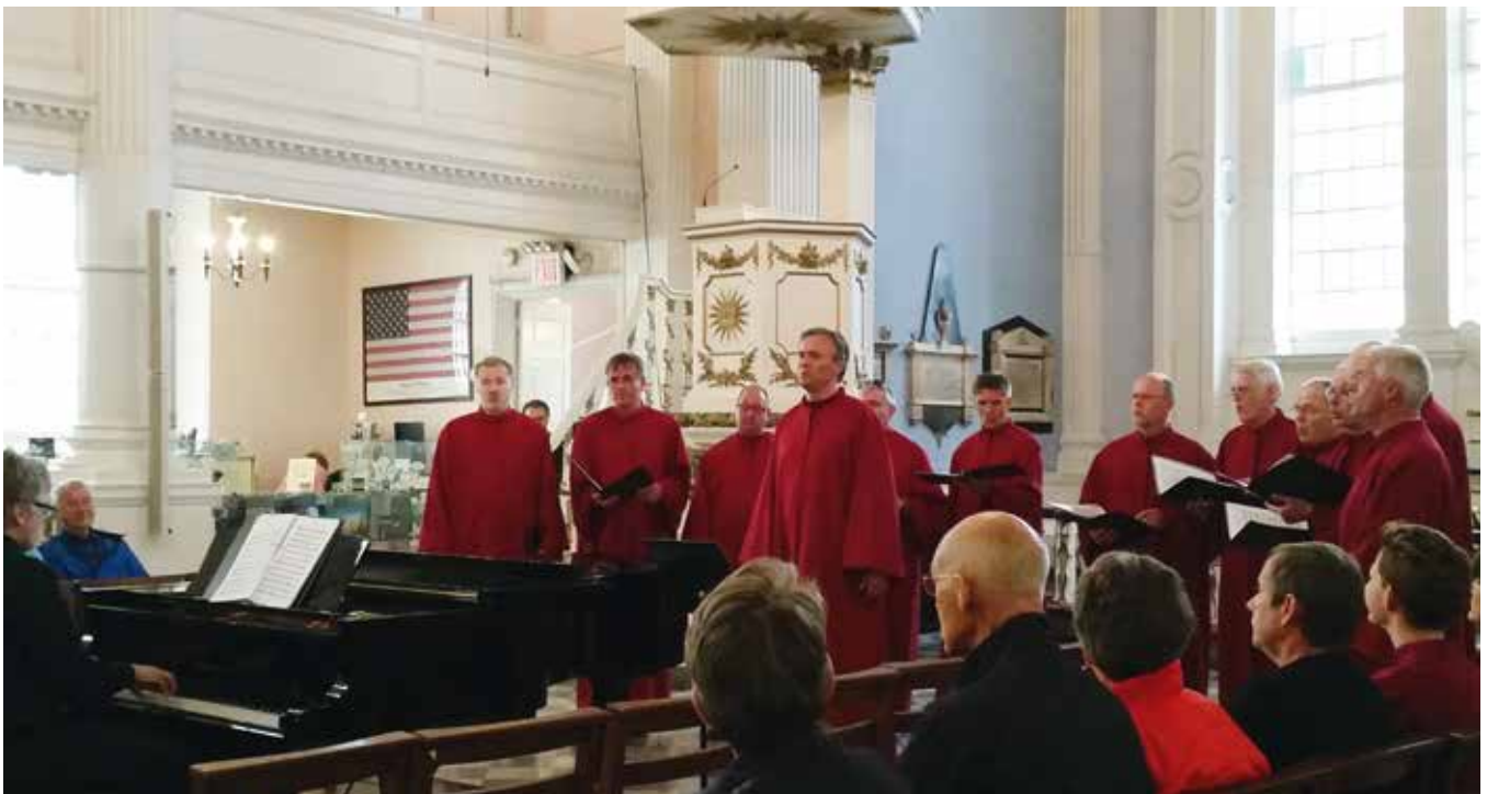
Mannskoret fremfører et solonummer i St. Pauls Chapel.

2001. Mandag holdt Mandal Kantori konsert i St.Pauls Chapel, og denne konserten var et av mange høydepunkt i løpet av de fem dagene vi var i New York. Tirsdag reiste en liten gruppe fra koret videre til Washington, mens resten av oss vendte nesten hjemover til Norge, proppfulle av inntrykk.