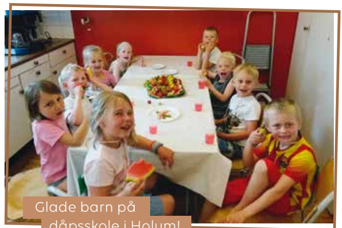
Glade barn på dåpsskole i Holum!