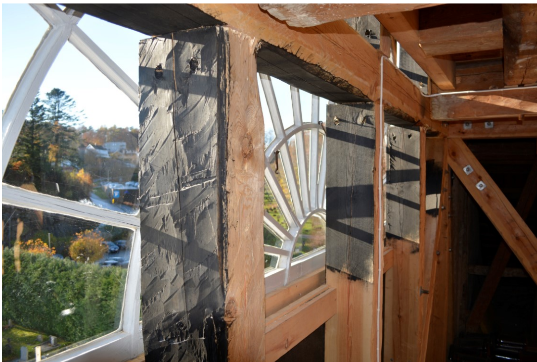
Det store buevinduet er nyrestaurert hos Vrolstad på Konsmo. Det kommer mer til sin rett nå når det er åpen vegg inn til tårnet.