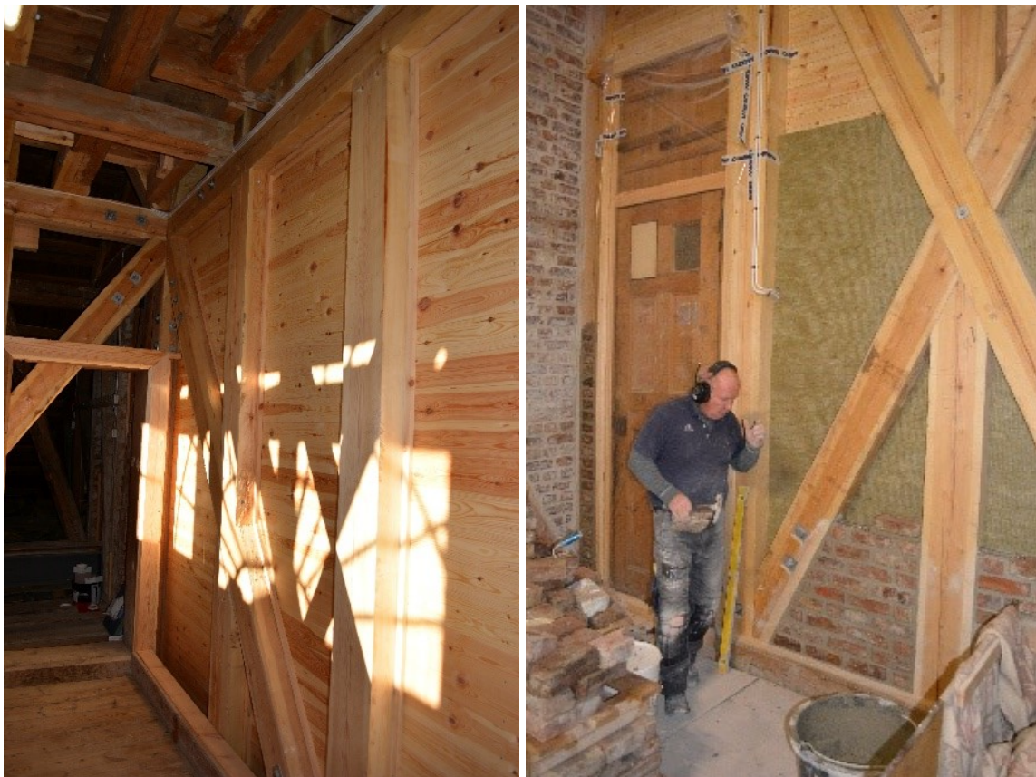
Del av ny konstruksjon. Opprinnelig omsøkt med plater, men kledd med panle fremstår dette ikke på samme måte som fremmede materialer. Mot orgelgalleri blir det lydisolert.