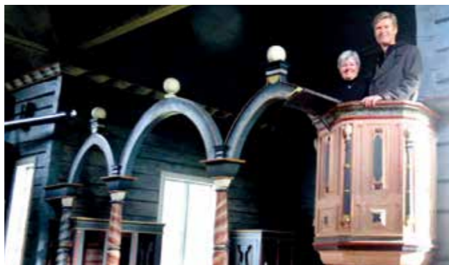
Prekestolen er blant det som blei flytta over frå gamlekyrkja. Så frå denne har Schiveprestane talt til kyrkjelyden sin.